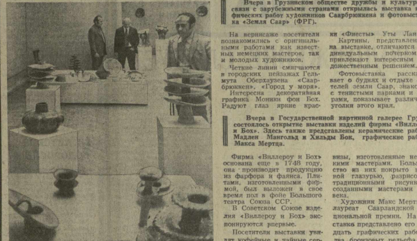
Выставки, входящие в программу Саарской недели ФРГ в СССР и открывшиеся вчера в столице Грузии, вызвали интерес любителей изобразительного и прикладного искусства. Многие тбилисцы побывали на вернисаже, знакомых с произведениями немецких художников-графиков, работами керамиков, изделиями старшей фирмы по производству фарфора и фаянса.

На снимках: сверху — на выставке в Государственной картинной галерее Грузии; справа — тбилисцы знакомятся с графическими работами немецких художников.