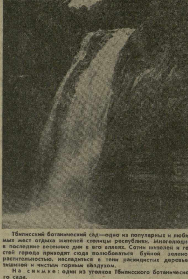
Тбилисский ботанический сад — одно из популярных и любимых мест отдыха жителей столицы республики. Многолюдно в последние весенние дни в его аллеях. Сотни жителей и гостей города приходят сюда полюбоваться буйной зеленой растительностью, насладиться в тени раскинувшихся деревьев тишиной и чистым горным воздухом.

На снимке: один из уголков Тбилисского ботанического сада.