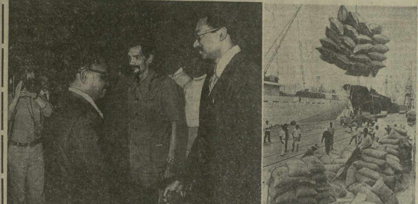
В Луанде состоялась торжественная церемония вручения «Золотой медали мира» имени Ф. Жолио-Кюри президенту Народной Республики Ангола, председателю Народного движения за освобождение Анголы (МПЛА) Агостино Нето. На снимке слева: премьер-министр НРА Лопу Да Насименту (справа) поздравляет Агостино Нето с вручением ему «Золотой медали мира». На снимке справа: порт Луанды.