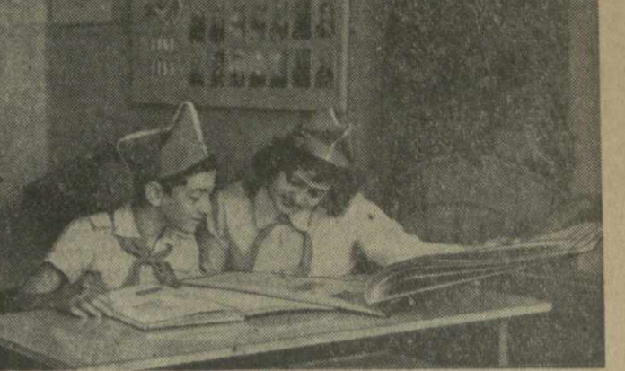
Сегодня — день рождения пионерской организации имени В. И. Ленина — самой массовой детской организации страны. Юные ленинцы растут активными участниками всех дел своей великой Родины, живут заботами и помыслами страны. Пионерские отряды и дружины собирают металлолом и макулатуру, лекарственные растения, сажают деревья, своими силами ремонтируют школы, отправляют на БМ книги и учебные принадлежности — не перечислить всех дел молодой смены!

Гнев и страх обывателя — «бундсбюргера» против приватизации предприятия «левых» стремился направить на всех, кто не исповедует безоговорочно и истоиво веру в устои капитализма, патлатый родно-советский анархизм, правящих банки и студентов, протестующих против фашизма в Чили; маювост с их провокационным «суперреволюционным» кликушеством и