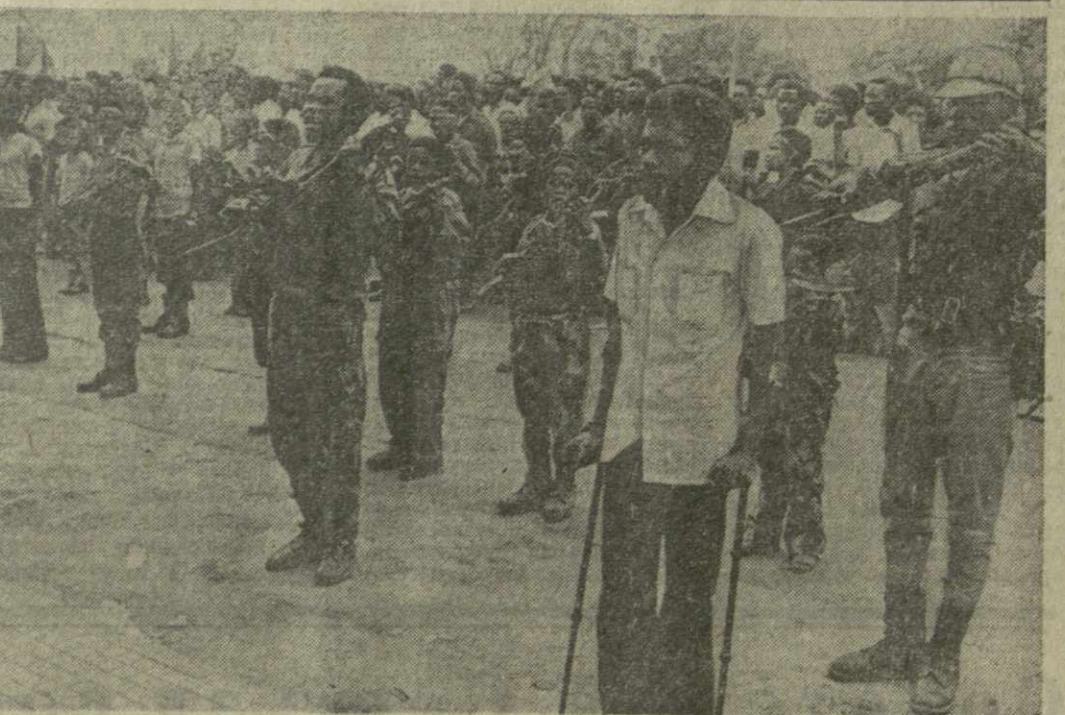
Интервенциями и отрядами раскольничьих организаций ФНЛА и УНИТА. Силам южно-африканских наемников и отрядам так называемой «португальской армии освобождения», вторгшимся с территории соседней Намибии, удалось продвигаться от захваченного ими портового города Моламеша далее на север страны. Эти силы, используя бронетанковые части, развернули наступательные операции на экономически важные центры страны — город Бенгела и порт Лобити.