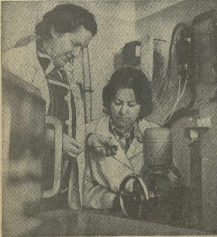
▲ В ЛАБОРАТОРИИ КОРРОЗИИ И ЗАЩИТЫ МЕТАЛЛОВ Института металлургии Академии наук Грузии проводится исследование коррозионной стойкости новых сталей, сплавов и защитных металлических покрытий.