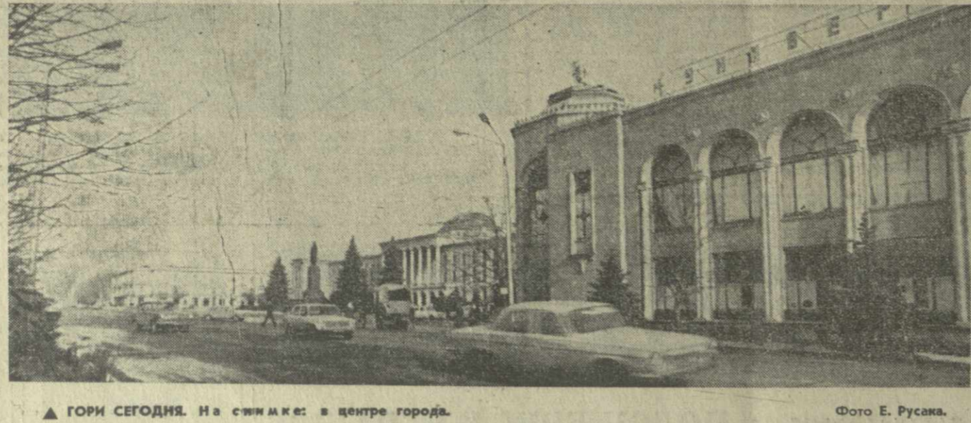
▲ ГОРИ СЕГОДНЯ. На снимке: в центре города.

что, несмотря на сложные метеосложности, полеты на всех типах самолетов по всем направлениям производятся регулярно.