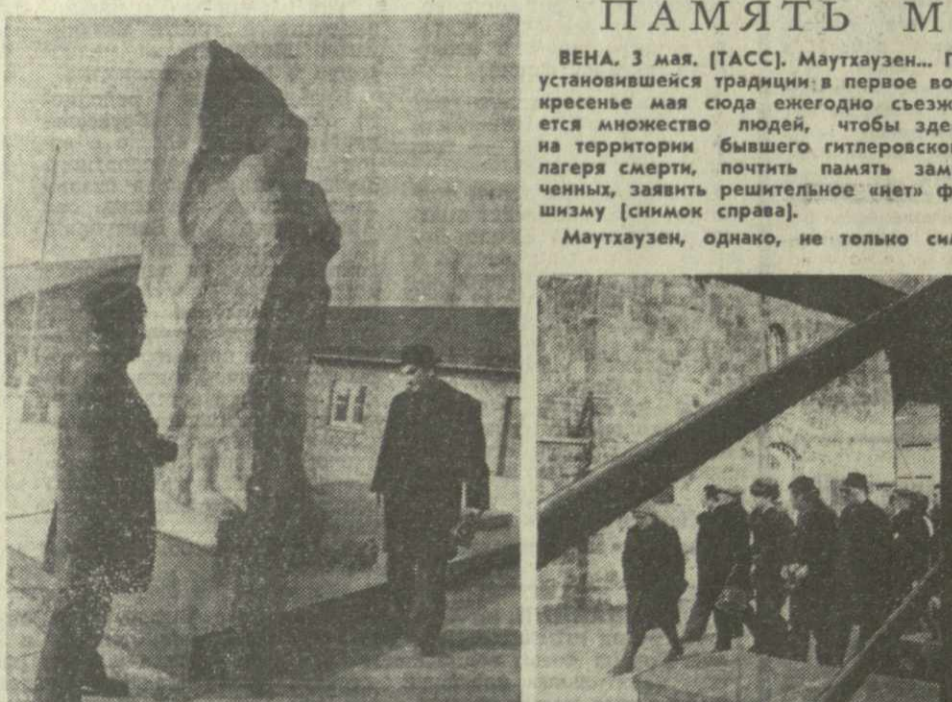
Вслед за событием

Англия. Деятельность КПСС направлена на превращение в жизнь, идей мир-