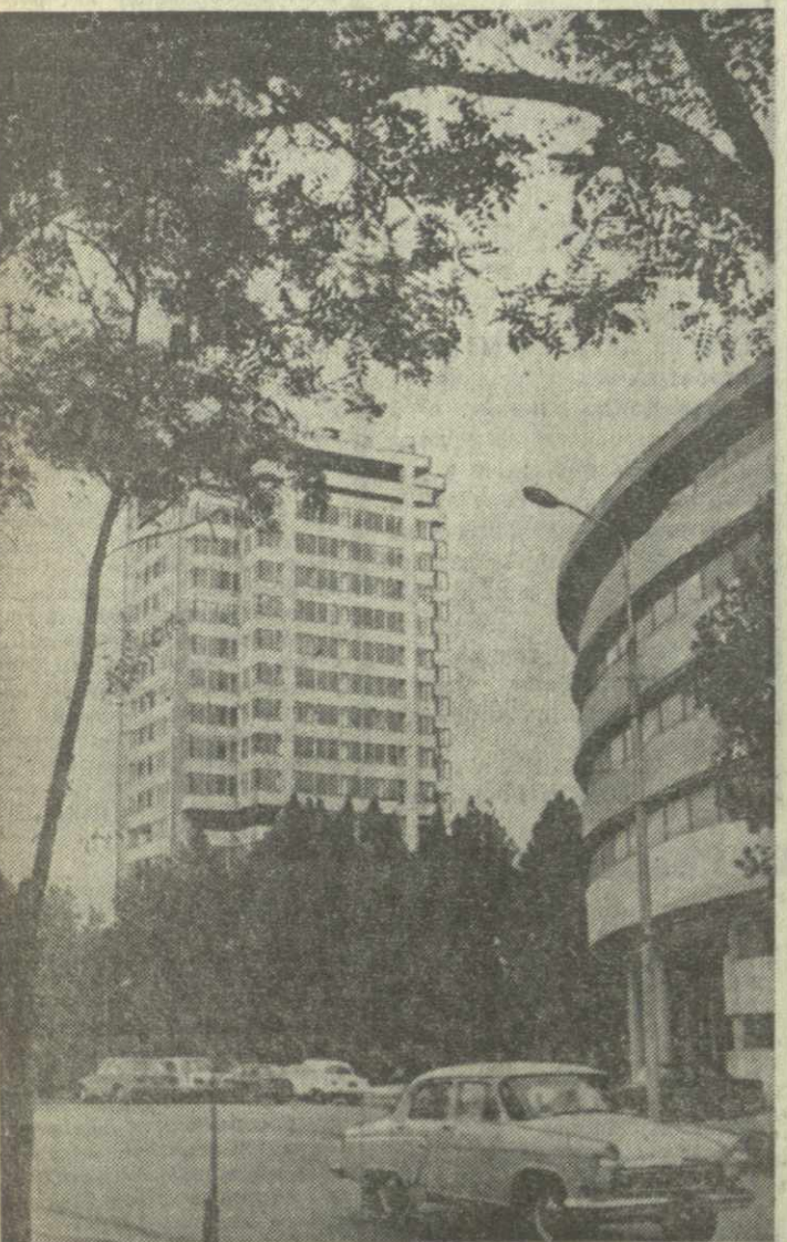
▲ ТБИЛИСИ. Улица Горгаласи сегодня.

анний концерт. 20.25 — Документальные комментарии. 21.00 — «Моамбе» — информационная программа. 21.30 — «После Хельсинки». 22.00 — Из Москвы. «Время» — информационная программа. 22.30 — За титул чемпионов мира по шахматам. 22.40 — Впервые на нашем экране. Художественный фильм «Ксения, любимая жена Федора». По второй программе. 18.05 — Киноочерк. 18.25 — Для студентов. Теоретическая механика. 19.25 — Киноочерк. 19.45 — Для студентов. Политэкономика. 20.30 — Объявления. 20.35 — Художественный фильм «Музыкальная история».