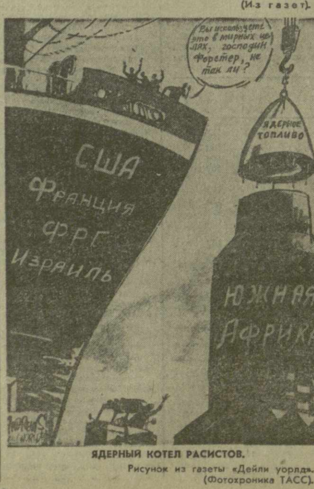
Ядерный котел расистов. Рисунок из газеты «Дейли уорлд».

Выступая на словах за мирное решение проблем юга Африки, капиталистические страны предпринимают лихорадочные усилия для наращивания военного потенциала режима Форстера, поставляют ему современное вооружение, а также оборудование, которое может быть использовано для производства ядерного оружия.