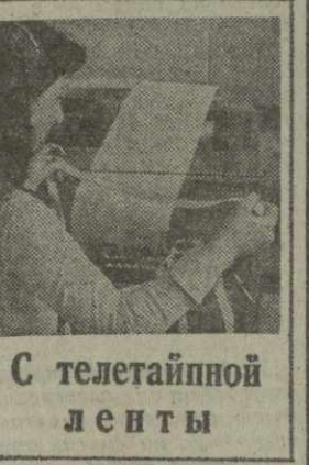
С телеграфной ленты

Председатель МПЛА призвал португальский народ, народы и правительства Африки, общественное мнение всего мира помешать империалистическим манерам, направленным на то, чтобы лишить ангольский народ независимости, а его единственного представителя — МПЛА — власти в стране.