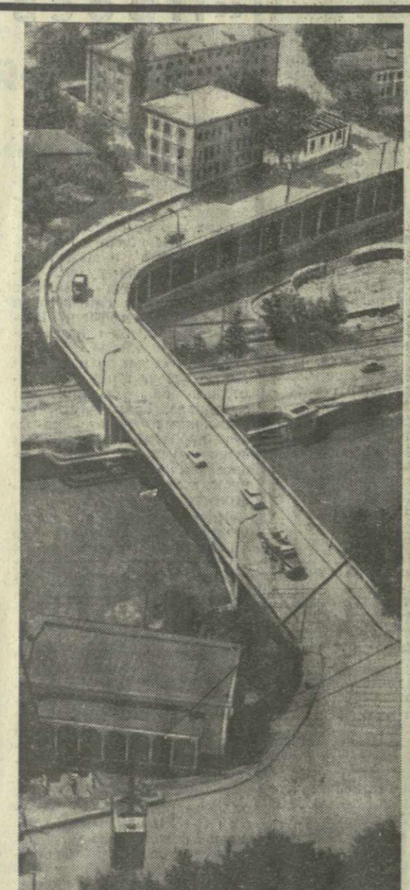
▲ ЧИАТУРА СЕГОДНЯ. Вид на город с шахты имени Орджоникидзе.

А завтрашний день Хренти еще прекраснее. В центре села предусмотрено строительство нового здания детского сада. В тенистых аллеях на склоне горы зацветут пионерские горы. Гости будущего оздоровительного лагеря станут дети горняков.