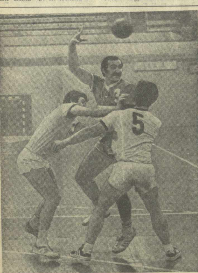
ЭТО ГАНДБОЛ

В обеих встречах победил наш земляк — 101:78 и 105:85. В первой встрече отличился А. Захаридзе, принесшая тбилисской команде 27 очков, а во второй — М. Николашвили (23 очка).