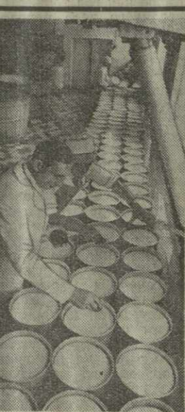
▲ ВОГДАВОНСКИЙ ГОЛОВНО-СПЕЦПРОЕКТООБЪЕКТ — предприятие коммунистического труда. Оно основано новейшим высокопроизводительным оборудованием. В Москве и Ленинграде, Киев и Харьков, Донецк и Одессе, Тбилиси и Мурманск, Баку и Сухуми, Рустави и Гагра отгружены вагоны. Здесь сыры швейцарский, голландский, советский, грузинский.

Продажа облигаций сберегательными кассами производится по ценам, установленным Министерством финансов СССР, а покупка их у граждан — по нарицательной стоимости.