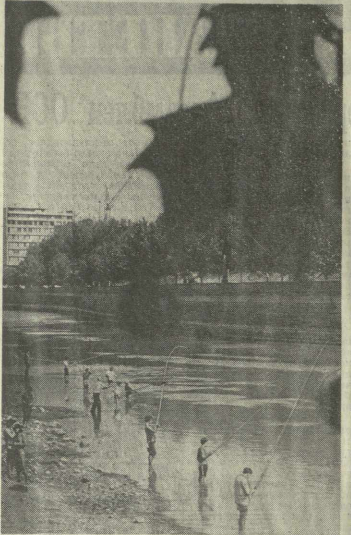
▲ ВОСКРЕСНЫЙ ДЕНЬ НА КУРЕ.