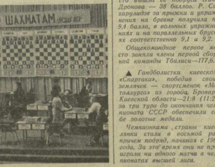
Кубок СССР по шахматам.