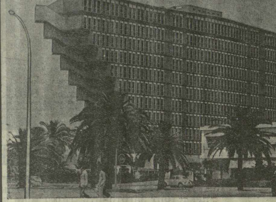
▲ ТУНИС — СТОЛИЦА ТУНИССКОЙ РЕСПУБЛИКИ, один из крупнейших городов страны. На снимке: здание гостиницы в центре столицы.

Город Сьенфуго, расположенный у входа во вторую по величине бухту Кубы, за годы народной власти буквально преобразился. Лет пятнадцать назад здесь, кроме сахарной промышленности, была относительно развита лишь энергетика. Сегодня Сьенфуго, сообщает журнал «Куба», важный промышленный центр, имеющий исключительно большое значение для экономического развития страны, самый крупный в мире порт для погрузки сахара.