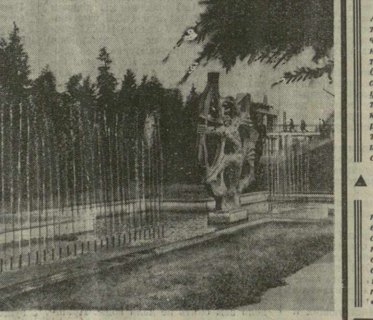
ТБИЛИСИ СЕГОДНЯ. Сивер у станции метрополитена «Дидубе».

Произведения Григола Абашидзе, вошедшие в собрание сочинений, переводили на русский язык и вставили прозамики и поэты. Среди них Е. Винокуров, А. Тарковерский, Н. Тихонов, А. Мажинский, М. Луконин и другие.