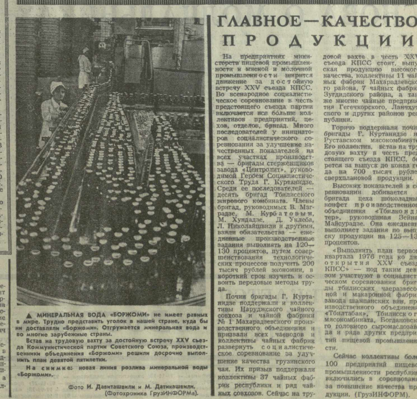
▲ МИНЕРАЛЬНАЯ ВОДА «БОРЖОМИ» не имеет равных в мире. Трудно представить уголок в нашей стране, куда бы не доставляли «Боржом». Отгружается минеральная вода и во многие зарубежные страны. Вста на трудовую вахту за достойную зарплату XXV съезда Коммунистической партии Советского Союза, производственные объединения «Боржом» решили досрочно выполнить план девятой пятилетки. На снимке: новая линия розлива минеральной воды «Боржом».

Л. ШИЛО, заместитель заведующего Московским городским отделом народного образования.