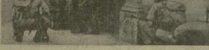
На снимке: патруль на улицах Буэнос-Айреса.

Военная хунта объявила о вводе мер в политической области, которые корреспонденты информации о них х