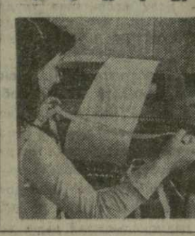
ЛОНДОН. Состоялся первый тур голосования по выборам нового лидера лейбористской партии, который займет пост уходящего в отставку премьер-министра Великобритании Г. Вильсона. В голосовании приняли участие 317 членов парламентской фракции лейбористской партии. Наибольшее количество голосов — 90 получил министр по вопросам занятости М. Фул. За ним следует министр иностранных дел Дж. Каллаган, собравший 84 голоса. Набранный 17 голосов министр по вопросам окружающей среды А. Крослэнд выбыл из дальнейшей борьбы за лидерство в партии, а министр энергетики А. В. Бени, получивший 37 голосов, решил снять свою кандидатуру.

Так как ни один из претендентов на пост лидера партии не собрал необходимого большинства голосов, 30 марта состоится следующий тур выборов.