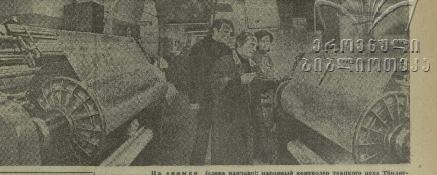
Группа за работой

бодневной темы, пунного объекта и последующем отборе заслуженных кадров. В каждом случае должны быть видны результаты проверки, наглядно свидетельствующие о ее действительности. В каждом комитете и группе целесообразно создать сектор гласности, объединяющий активистов, владеющих пером. Работу таких секторов следует осуществлять под руководством организационных отделов в составе инспектора комитета НК, работников газет, радио, телевидения, рабкора, члена «Комсомольского проектора», художника и фотокорреспондента. Непрерывные условия правильной организации гласности — объективность, принципиальность, открытость и ясность, конкретность, четкая целенаправленность и плановость работы. Хочется заострить особое внимание на необходимости четкой целенаправленности в работе. Дело в том, что еще нередки случаи, когда в материалах, помещаемых на страницах народного контроля («Нанги», «Молния», «Экали», «Шолти») неоправданно много внимания уделяется мелочам, а ответственные задачи остаются вне поля зрения. Первейший долг органов народного контроля состоит в помощи партийным и государственным органам в деле организации систематической проверки фактического выполнения заданий партии и