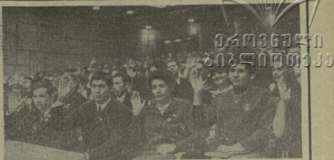
Москва, 22 декабря. Кремлевский Дворец съездов. Совместное торжественное заседание Центрального Комитета КПСС, Верховного Совета СССР и Верховного Совета РСФСР, посвященное 50-летию образования Союза Советских Социалистических Республик.

Заседание Совета Старейшин Верховного Совета Грузинской ССР состоится в 9 часов 30 минут утра 27 декабря 1972 года в зале заседаний Президиума Верховного Совета Грузинской ССР.