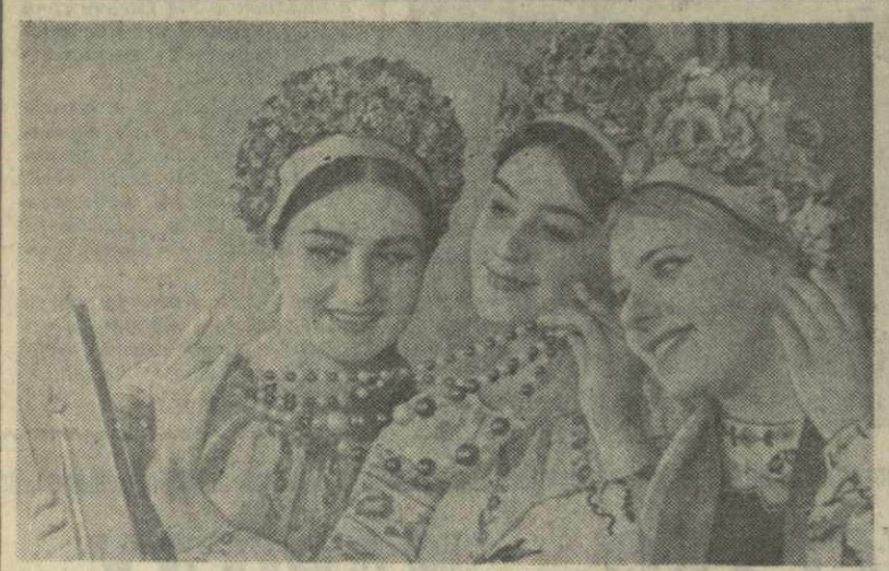
Украинская ССР. Эти веселые девушки — солистки Житомирского хореографического ансамбля «Львов», любимцы полесских зрителей. Талантливый коллектив побывал во многих городах страны, и везде артистам сопутствовал успех.

Сообщают корреспонденты ТАСС, газет братских республик, ГрузИНФОРМа, «Заря Востока»