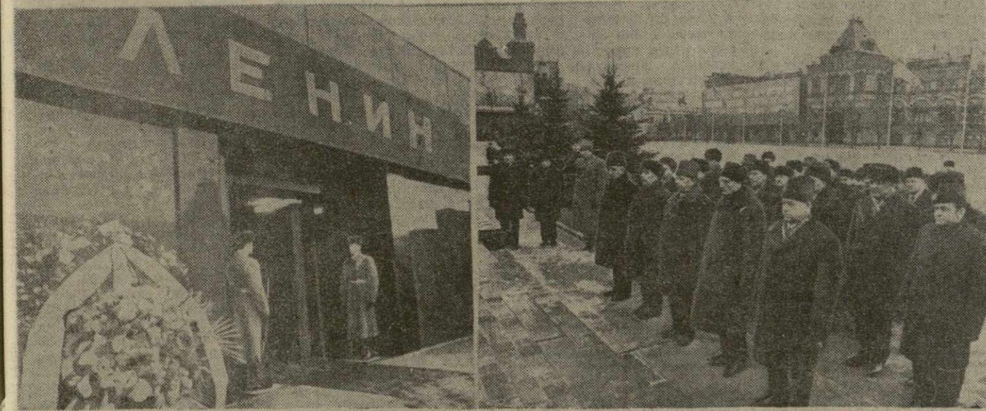
МОСКВА. 20 декабря. Возложение венка к Мавзолею В. И. Ленина от Центрального Комитета КПСС, Президиума Верховного Совета СССР и Совета Министров СССР и Советского государства.