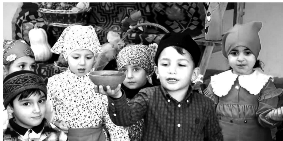
ბავშვების წარმომადგენელთა დასწრების გამო. ბაღის აღსაზრდელებმა თავიანთ პედაგოგებთან ერთად ტრადიციულ