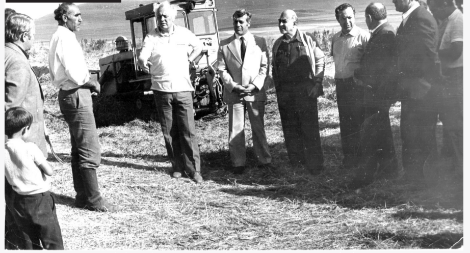
ე.შეპარდნაძე ნიალაში. 1979 წელი. სურათი მოგვანოდა ქეთევან ლოლაძემ