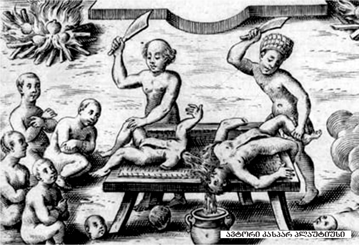
ავტორი პასკარ პლავუტიუსი

ახლანან პოლივედური სკანდალი ატყდა და საეჭვო ქმედებებში ისეთი ცნობილი პირები აღმოჩნდნენ გარეულები თუ ჩათრეულები, პირდაპირად გარდა სექსუალური ძალადობისა, ადნოქრომზეც ითქვა, რაც სრულებით არ გამკვირვება.