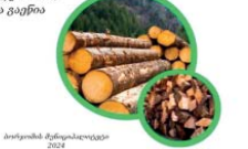
ბორჯომის მუნიციპალიტეტის ინიციატივით, სოციალურ და უკულ 528 ოჯახს, საშუალო მერქის შესაძენად, 200 ლარის ოდენობით, უნაღდო ანგარიშსწორებით დახმარება გაინია.

აღსანიშნავია, რომ ბორჯომის მუნიციპალიტეტში 25-მდე სოციალური პროგრამა ხორციელდება, რომელთა მთავარი მიზანია ადგილობრივი მოსახლეობის მატერიალური და სოციალური მდგომარეობის ხელშეწყობა და გაუმჯობესება.