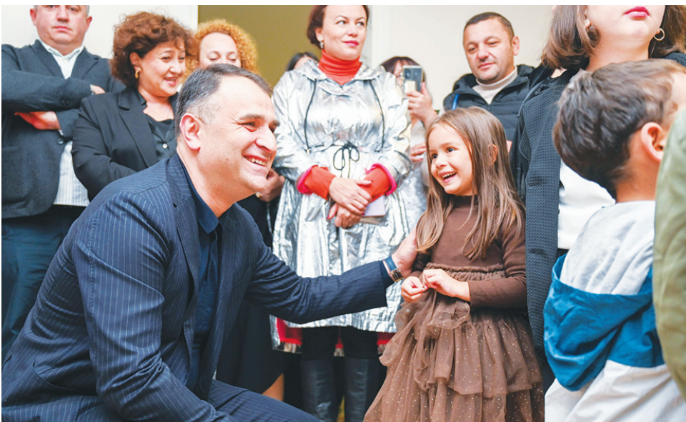
ჩილ ჩიქოვანი. საბავშვო ბავშვის მშენებლობა დასრულდა გუბაშვილის ქუჩაზე, აეროპორტის გზატკეცილზე მიმდინარე ბავშვის მშენებლობის დასრულებას კი წლის ბოლომდე ვარაუდობენ. მუნიციპალური განვითარების ფონდის დაფინანსებით, დამატებით კიდევ 6 საბავშვო

ნაწილობრივ დაზარალებული ბავშვის ბაიხსნა. თანამედროვე სტანდარტის ბავშვთა ბაიხსნის დასაწყისი მომენტები შენიშნავს სრულად არის ადაპტირებული შუამდგომლობის პროცესში. ბავშვის ეზოში მოწყობილია შესაბამისი ინფრასტრუქტურა და სპორტული მოედანი. ახალი ბავშვის გახსნას ბათუმის მერი არჩილ ჩიქოვანი მოადგილე ლელა სურგულაძისთან და ბათუმის საბავშვო ბავშვების გაერთიანების დირექტორ დავით დიასამიძესთან ერთად დაესწრო. - კიდევ ერთი ძალიან მნიშვნელოვანი ინფრასტრუქტურული პროექტი დასრულდა - ექსპლუატაციაში შევიდა სკოლამდელი აღზრდის ახალი დაწესებულება. თანამედროვე სტანდარტის საბავშვო ბავშვთა ბაიხსნა აღჭურვილია უახლესი ინფრასტრუქტურით. პარალელურად, მიმდინარე წელს კიდევ ორი საბავშვო ბავშვის მშენებლობა დასრულდება და ჯამში 11 მილიონ ლარზე მეტი დაიხარჯება. საბავშვო ბავშვების მშენებლობასა და შესაბამისი ინფრასტრუქტურის მოწყობას ქალაქის სხვადასხვა ადმინისტრაციულ ერთეულში, მომავალშიც გავაგრძელებთ, - განაცხადა არ-