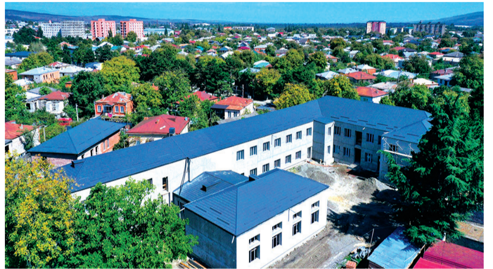
რომლის ფარგლებშიც 37 სკოლის მშენებლობა-რეაბილიტაციაა გათვალისწინებული სამშენებლო სამუშაოები 2024 წლის ბოლოს დასრულდება

№2 საჯარო სკოლის რეაბილიტაცია-მშენებლობა ხორციელდება მსოფლიო ბანკისგან მიღებული სესხისა და სახელმწიფო ბიუჯეტის თანადაფინანსებით,