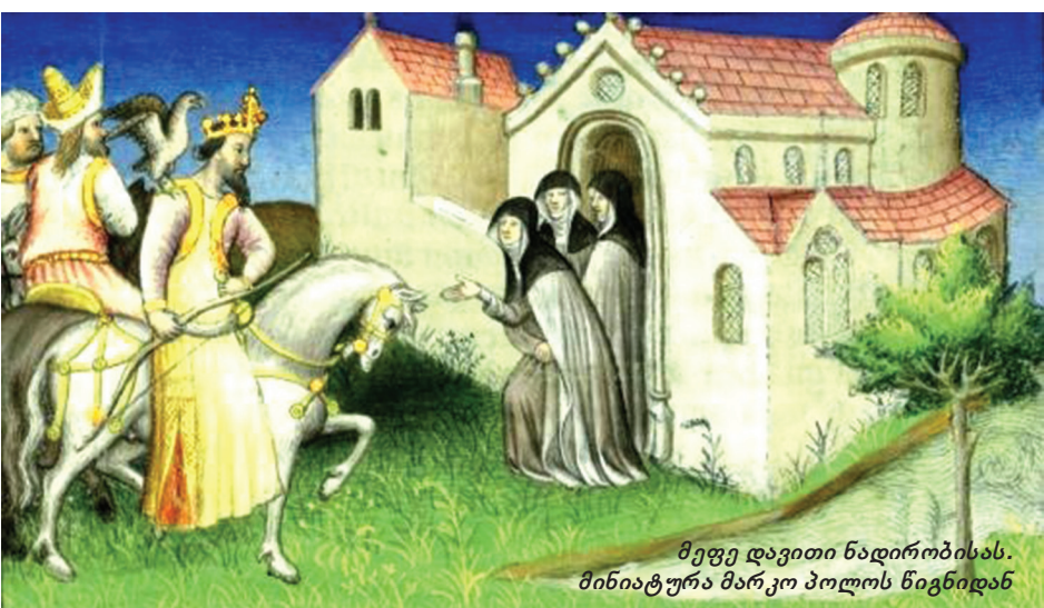
მეფე დავითი ნადირობისას. მინიატურა მარკო პოლოს ნიგინიდან

ჯვარი ისევ ჩაიდა უბეში. „მშაიო,“ ანიშნა ხელით. ანანიამ ხურჯინიდან ყველი და პური ამოიღო. უხმოდ დაუდო მუხლებზე. ჯაბანამ კარვის ჩამოკეცილი კალთა ასწია მაღლა, მოძებნა ტიკი. ქამარზე მიხმული მომცრო ყანნი შეიხსნა, ღვინით აუვსო და მიანდა უცხობი. ხარბად დააჯიხრა ხმელ პურსა და ყველს ცხვირმიჭყლებლი. მადიანად ილუკებოდა, თან ყლუპ-ყლუპით ატანდა ღვინოს. შიმშილი რომ დაიოკა, ხელეზე დაიხედა, უცხურად დაატკაცუნა თითები. კალთაში მიმოფანტული პურის ნატყები აკრიფა, ხელისგულზე დაიყარა, ეამბორა. უბიდან ამოღებულ ძონძში გაახვია და ჯვრის გვერდით უბეში მიუჩინა ბინა.