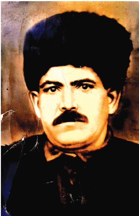
ჩვენი გაზეთის ერთგულმა მკითხველმა კარგად იცის, რომ სამცხე-ჯავახეთში, წინა საუკუნეებში, არაერთი მესანიშნავი სახალხო

მთქმელი თუ აშული ცხოვრობდა და მოღვაწეობდა, რომელთა სახელები თანამედროვეობას დღემდე შემორჩა და მათი შემოქმედება ახლობელი და საყვარელი გახდა ხალხური პოეზიის მოყვარულთათვის. ამასთან, გაზეთმა „ლიტერატურულმა მესხეთმა“, წლების განმავლობაში, კიდევ ბევრი საინტერესო ამუღისა თუ სახალხო მთქმელის სახელი გამოამხეურა და ფართო საზოგადოებას მიანოდა „მესხური ფოლკლორის“ სამტომეულის ორი ტომის სახით, სადაც განსაკუთრებული ადგილი მათ შემოქმედებასაც უკავია. გარდა ამისა იყვნენ აშულები, რომლებიც