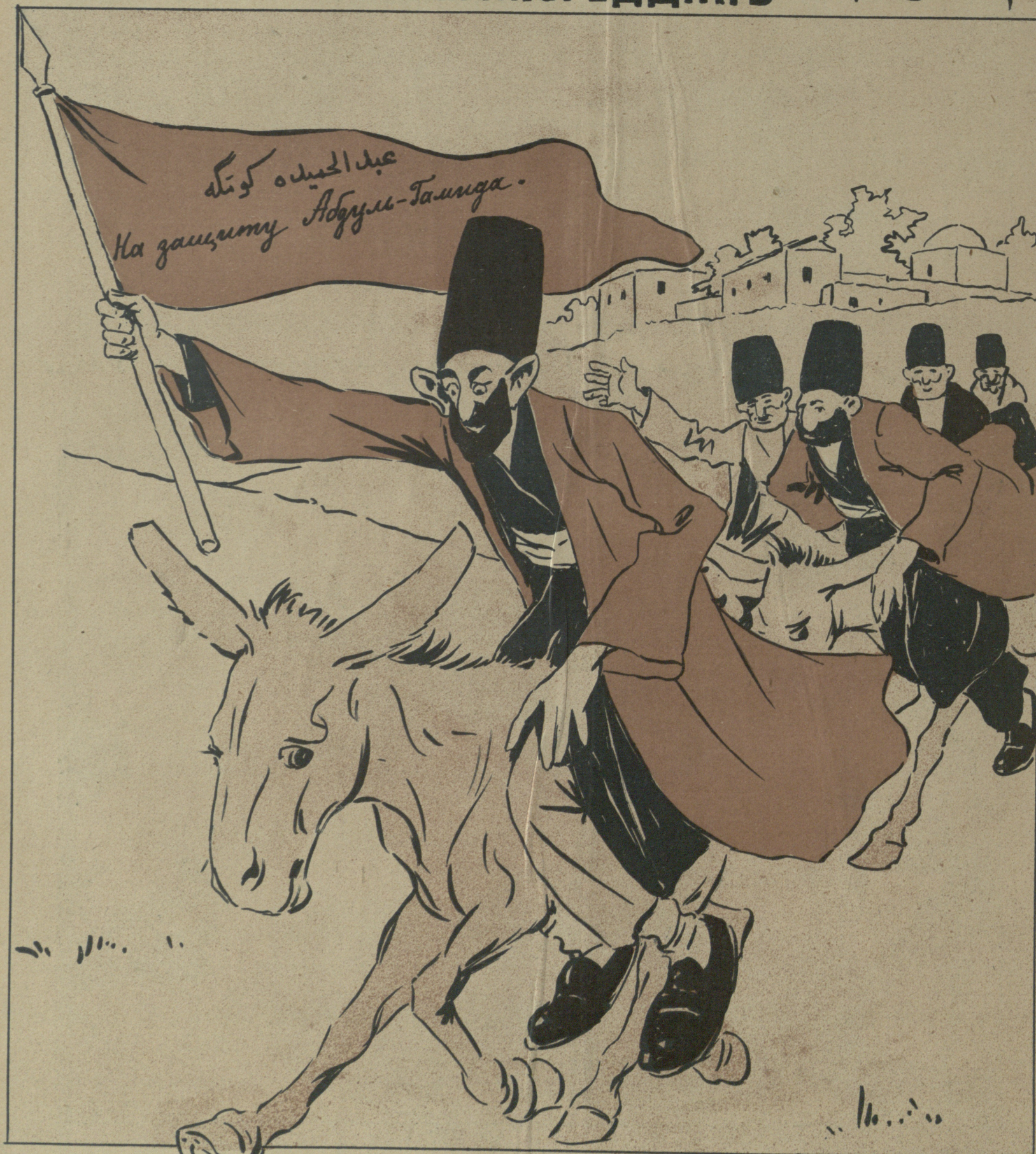
کوسا حاجی ابراہیمون دستہ سی . Отрядъ Кеса - Гаши - Ибраһима (Шешаха)

№26 Цѣна 12 к. МОЛЛА НАСРЕДИНЪ قیمت ۱۲ فیک ۲۶