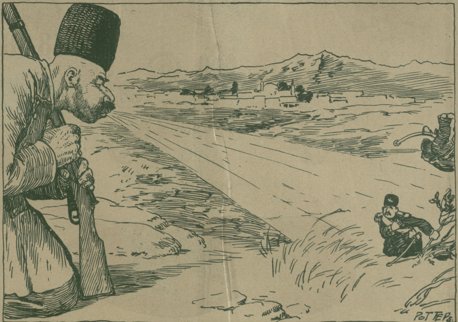
... سن اولسن دوز ايکي ساعات دوروشام بوردا سنعلينى گوزليوروم نلسون گيمه ک تبر اوسته .