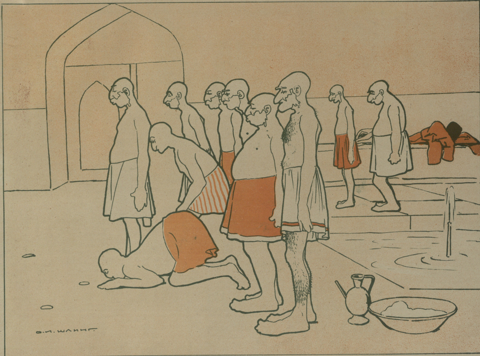
Be Sams. (Haxurebasu).