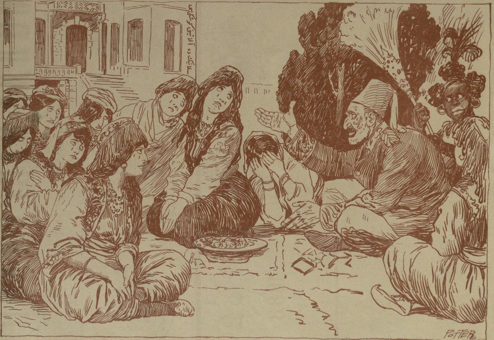
سن الله دنيانون ايشينه باخ : مليونلاريم آلمانيا بانقلارينده يانا يانا من بوراده يادان بوزباشه محتاج اولوشام .