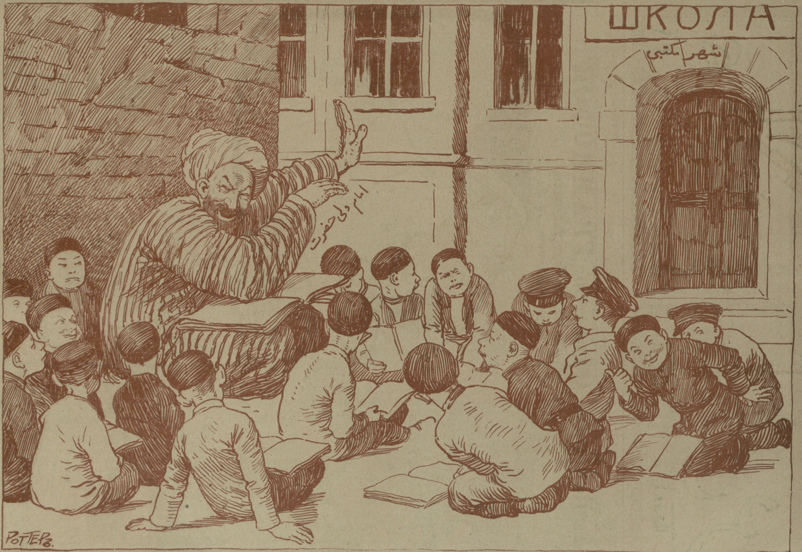
« اورینبورغ دہ برہمی محلہ امامی ولی حضرت مسلماناری اینانڈ پروب کہ شہر پولی ایله آمیلان مکتب دہ اوشاق اوخوتماق حرام در و بو فند » نن محلہ اوشاقلارینی مکتب دن کنار ایلور کہ اوزی اونلاری اوخوتسون « (وقت، غازیته سی، نومر ۱۴۵۷) »