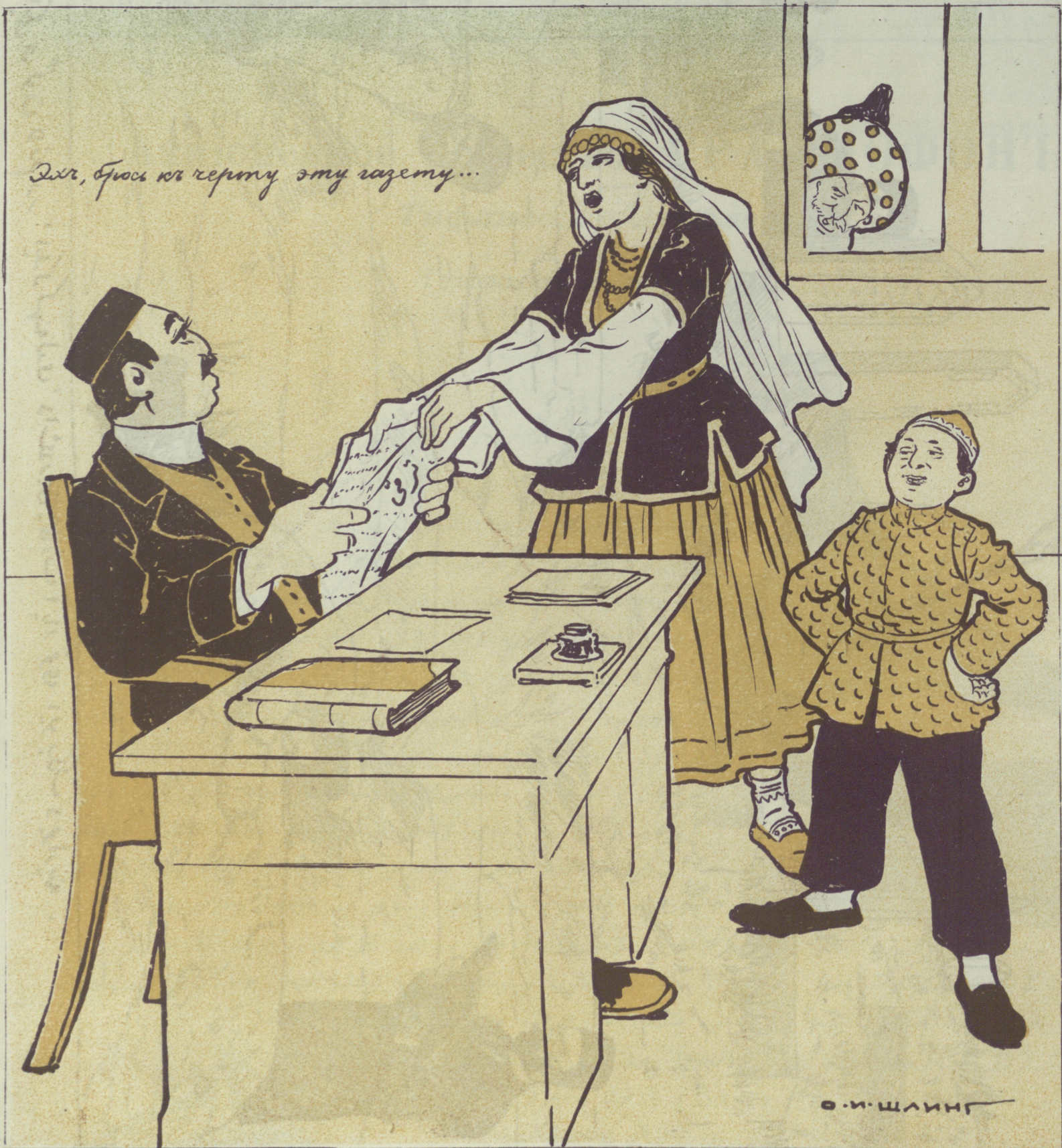
آکشی 'سن الله' آت گیتون جهنه بوزهرماری 'خوصله م دار بجدی .

№4. Цѣна 12 к. МОЛЛА НАСРЕДДИНЪ قیمتى ۱۲ قېك ۱۴