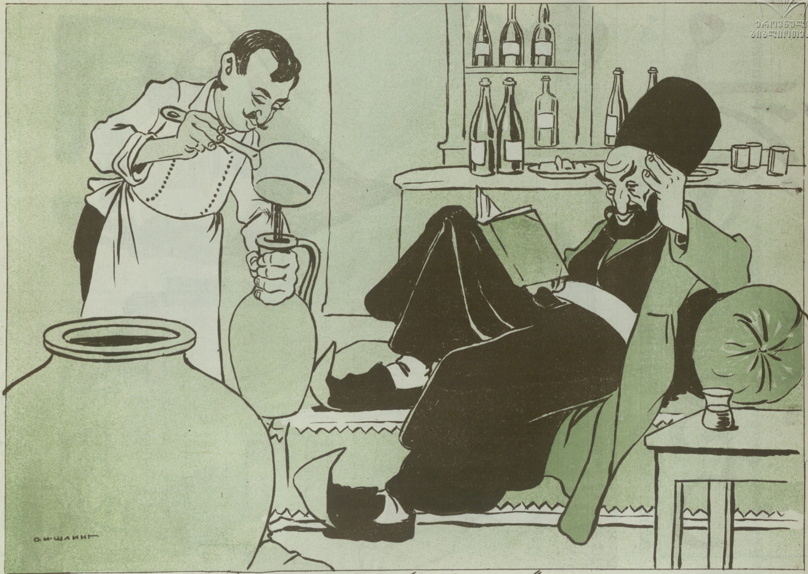
Տալի ԲԵԾ ԵՎ ԳՐԱՆ ԶԱՆ ՄԻ ԿԵ ԴԵՊԱՆ ՍԵՐԵՐԸ ...