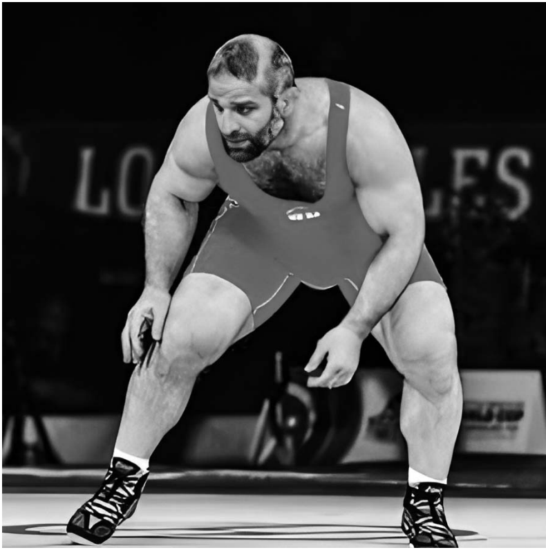
დასასრული. დასაწყისი იხ. „სბ“ N31

დიდი მოჭიდავე გამოვა, ჭიდაობაზე მიიყვანეთ.