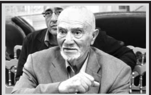
საქართველოს პრემიერ-მინისტრი ირაკლი კობახიძე გამოჩენილი პოეტის, მთარგმნელისა და საზოგადო მოღვაწის

იმსახურებდა თუ არა ქვეყანა კანდიდატის სტატუსს და ამ ნეგატიური კამპანიის ფონზე ქვეყანამ მიიღო კანდიდატის სტატუსი. ახლაც არავისთვის არ არის გასაკვირი, რომ ამ ადამიანებს უნდათ ქართველი ხალხის დასჯა ერთადერთი მიზეზის გამო - ქართველი ხალხი მყარად უჭერს მხარს „ქართულ ოცნებას“ და უარს ეუბნება რადიკალურ ოპოზიციას, კოლექტიურ „ნაციონალურ მოძრაობას“, თუმცა, ვფიქრობ, ყველაფერი ძალიან კარგად განვითარდება ჩვენი ქვეყნისთვის, ქართველი ხალხისთვის და საბოლოო ჯამში ჩვენ აუცილებლად მივაღწევთ დასახულ მიზნებს“, - განაცხადა ირაკლი კობახიძემ.