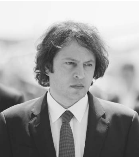
ირაკლი კობახიძის „კამპანია „ჩემი ხმა“-ს შესახებ“

„კამპანია „ჩემი ხმა“, რომელიც უცხოური ფულთი ფინანსდება, უხეშად უპირისპირდება საარჩევნო პრინციპებს. რეალურად, ეს არის საარჩევნო კამპანია და არა სადამკვირვებლო მისია. თქვენ შეგიძლიათ იხილოთ მათი საარჩევნო, სააგენტო მასალებიც, სადაც ისინი პირდაპირ აწარმოებენ აგენტაციას კონკრეტული ძალების სასარგებლოდ და კონკრეტული პოლიტიკური ძალების საწინააღმდეგოდ. ერთი უხეში დარღვევა არის ის, რომ საარჩევნო კამპანია ფინანსდება უცხოური ფულთი და მეორე, საინტერესო არის ის, რომ ამ კამპანიაში არიან ჩართულები ე.წ. ადგილობრივი სადამკვირვებლო ორგანიზაციები. ანუ, არის ორგანიზაცია, რომელსაც აქვს ფორმალურად პრეტენზია, რომ უნდა იყოს ნეიტრალური დამკვირვებელი და ამ დროს ის პირდაპირ არის ჩართული საარჩევნო აგენტაციაში, კონკრეტული პოლიტიკური პარტიების სასარგებლოდ და კონკრეტული პოლიტიკური ძალების საწინააღმდეგოდ. ეს არის საარჩევნო პრინციპების უხეში დარღვევა და ამ უხეში დარღვევის უცხოური დაფინანსება არის დამატებითი საარჩევნო პრინციპების დარღვევა. ზოგადად, სამწუხარო არის ის, რომ ეს არჩევნები წარმართება უპრეცედენტო უცხოური ჩარევის ფონზე. კარგი არის ის, რომ ეს უცხოური უპრეცედენტო ჩარევა, რაც წინააღმდეგება საარჩევნო პრინციპებს, ვერ აისახება არჩევნების შედეგებზე.“ - განაცხადა პრემიერმა.