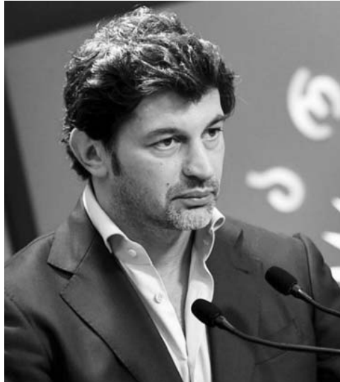
კახა კალაძე საქართველო-აშშ-ის ურთიერთობების შესახებ

ორმაგ სტანდარტებს, სადაც ვიღაც იწონებს ფიზიკურ თუ ვერბალურ თავდასხმას ადამიანებზე, იქ უკვე ღრმავდება ასეთი პროცესები. შესაბამისად, ყველას მოუწოდებ, ნუ იმოქმედებთ ორმაგი სტანდარტებით. ყველა ერთად უნდა ვებრძოლოთ საქართველოში ლიბერალურ ფაშიზმს, რაც არის აბსოლუტურად ისეთივე მიუღებელი იდეოლოგია და მიმდინარეობა, როგორც იყო ბოლშევიზმი 100 წლის წინ.“ - განაცხადა ირაკლი კობახიძემ.