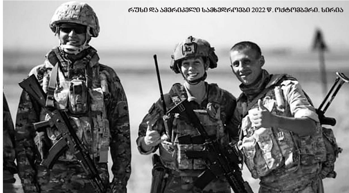
რუსი და ამერიკელი სამხედროები 2022 წ. ოქტომბერი. სირია

კი, კი, სანქციების სახით რუსეთის ნამდვილად „მეგობარი აქტი“ გაუკეთეს, მას შემდეგ უფრო გამდიდრდა... აკი ვთქვი, აშშ და რუსეთი ერთნი არიან-მეთქი, საბრალო უკრაინელი ხალხის სისხლზე ერთი ბოროტი დევიც კარგად ხეირობს და მეორეც,