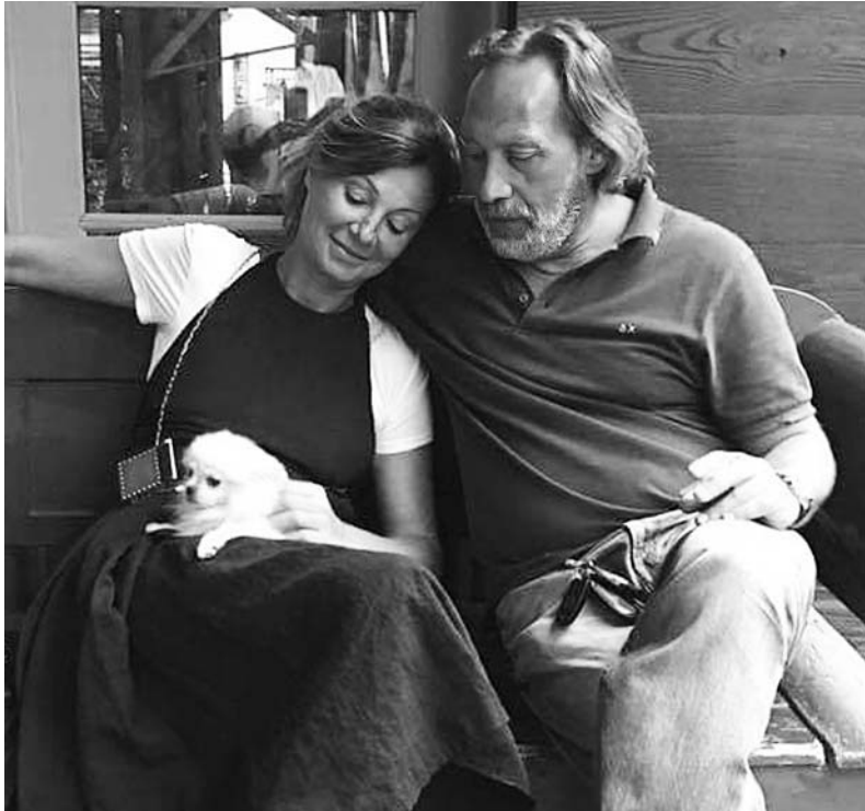
(დასასრული. დასაწყისი იხ. „სა“ N25)