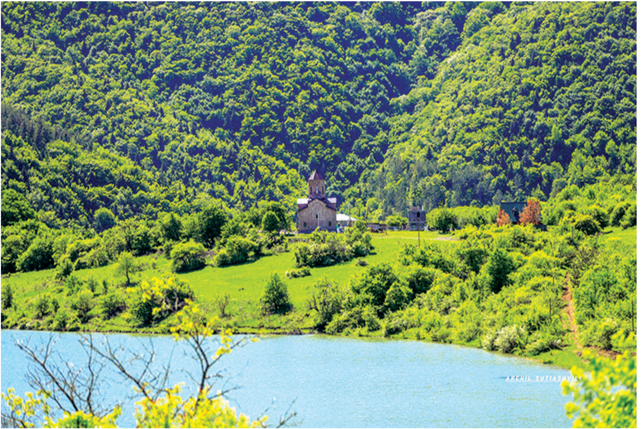
საშურის მუნიციპალიტეტის ტურისტული ღირსშესანიშნაობები. კოდისწყაროს ტბა წლის ნებისმიერ დროს მშვენიერია.