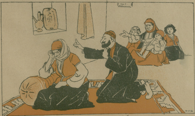
آسمان ادغوللاری قیزنا جیرماغی لهنر حساب ایدرلر، دورت اوشاغ آنا سندن خبرلری یوخ!