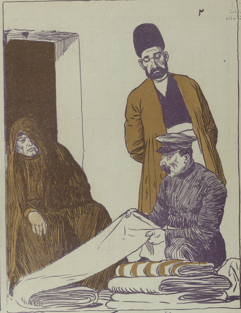
اوزگی اورت کیشی گلدی