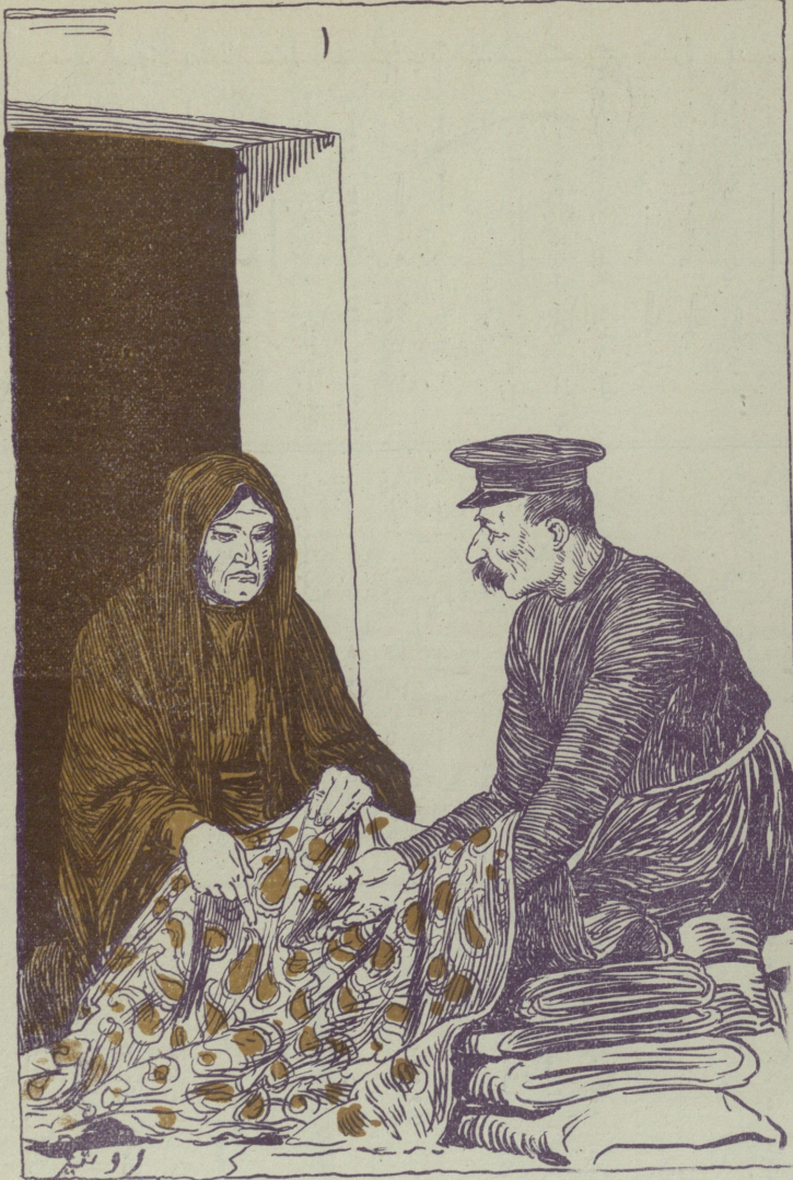
ایرمنی محرم در