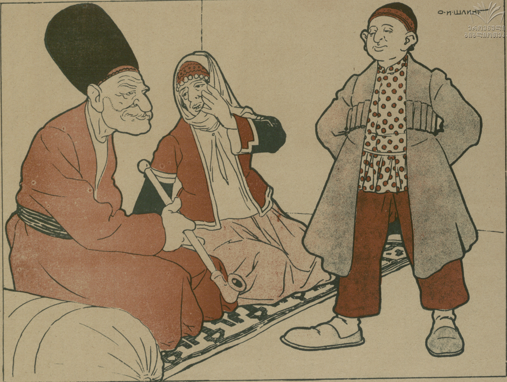
‘آكشى’ بوادغلان لاپ يكله لوب ديزيخ اولدى ‘ به نه واقت بوني اولندير چه مك