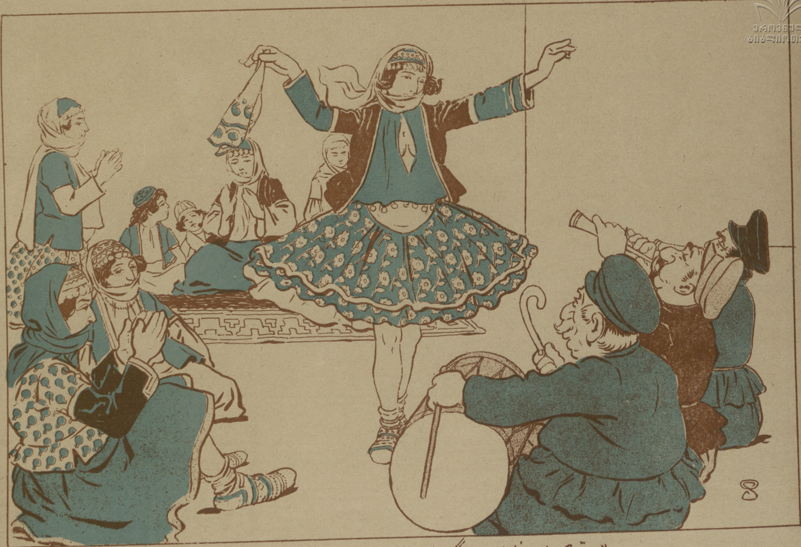
« თოპჩი ლარ ნა მხრმ დგლ რ » ( ნიქიან თოპი )