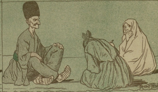
կնն Բր սագճն սոքրա