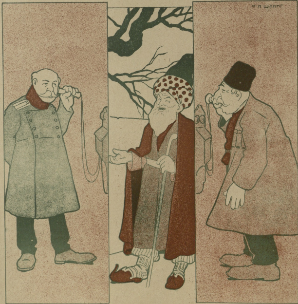
... نچر نیک آغا ' قاسم بک بردانه بردانقا آلوب سامانیخدا گیزله دوپ ...