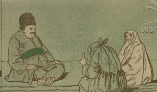
բր սագճն սոքրա