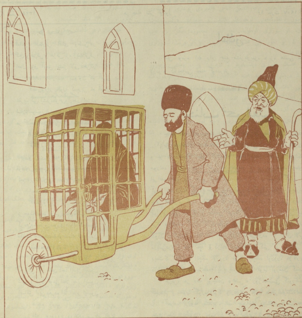
آنا و آروادا اعتبار یوضی . (حمام سفری)