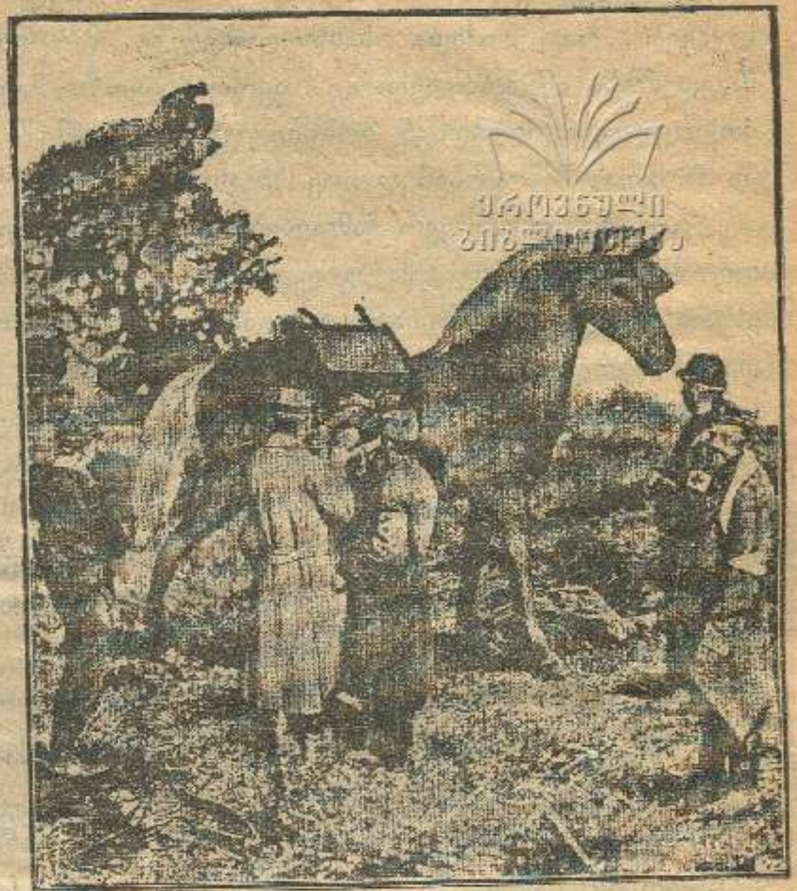
მიბაძვა ტროიელებისა: ხის ცხენების მუცელში გერმანელები ინახავენ სამხედრო და სამკურნალო სურსათს.