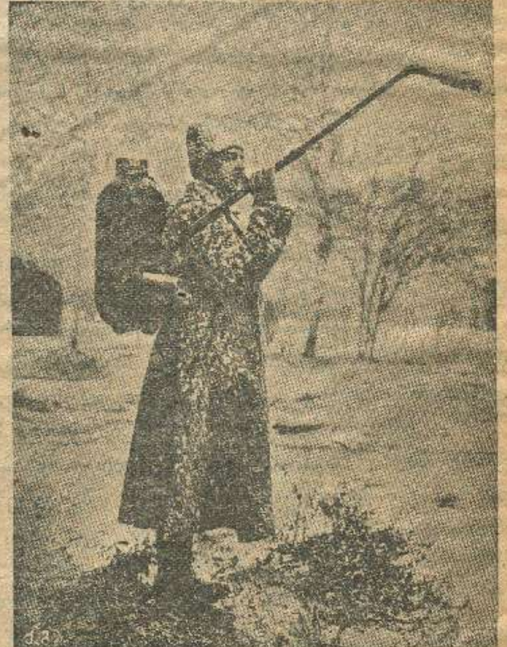
გერმანელებისაგან გამოგონებული მანქანა მტრისათვის ცეცხლის სითხის შესასხმელად.