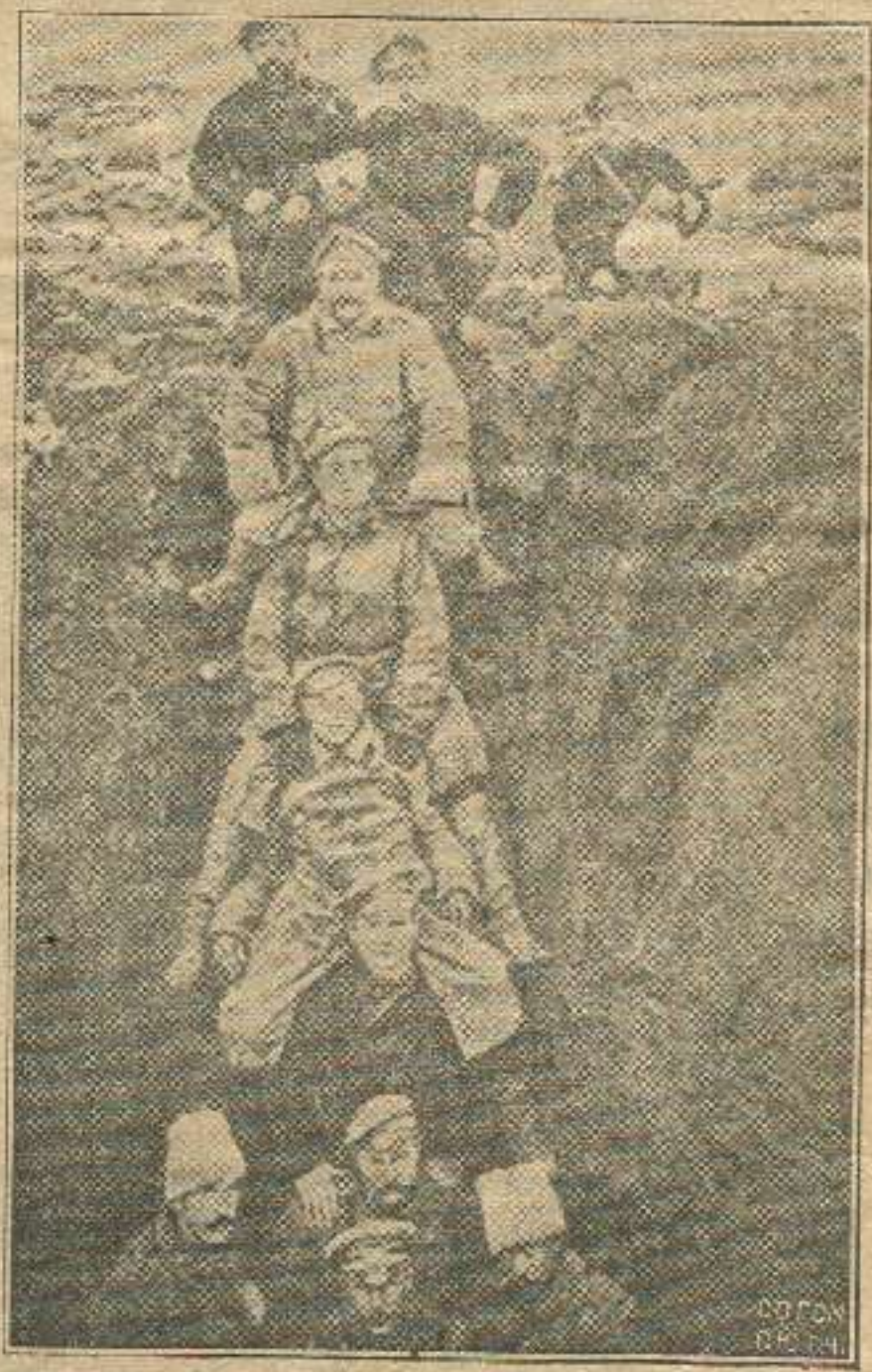
გერმანულ ყუმბარებისაგან ამოთხრილ ორმოში.