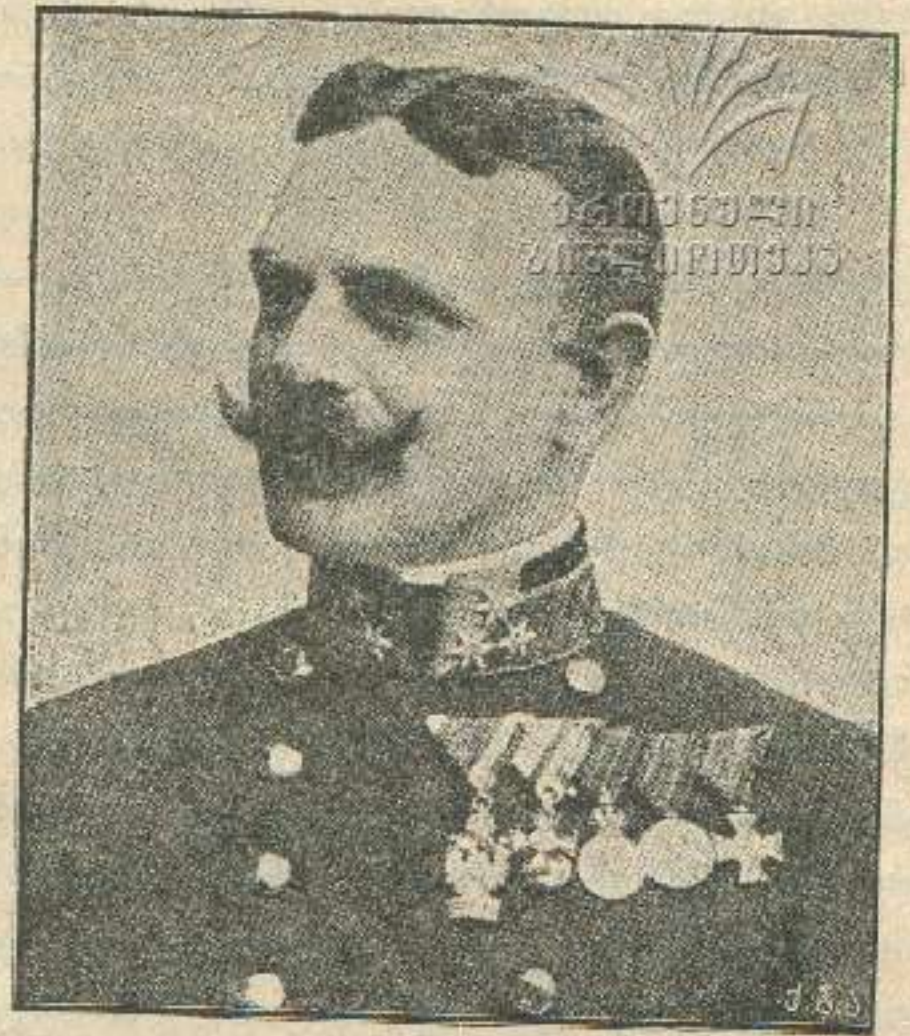
1. ერცჰერცოგი ფრიდრიხი, ავსტრიის ჯარების მთავარ-სარდალი, რომელმაც ვერ მოახერხა პერემიშლის განთავისუფლება. 2. გენერალი კუსმნეკი, პერემიშლის კომენდანტი.

ვწერთ, და, როგორც ყველა სხვა კულტუროსან ერებს შეუქმნიათ, ჩვენც შევქმნათ საერთო აკადემიურ-ლიტერატურული ენა. და წარმოიდგინეთ, კინალამ გაიყვანა ეს მრავალთავის (და მათ შრის თქვენ უმორჩილეს მონისათვისაც) ძნელად შესაგუებელი და «სახლაფორთო» მოსაზრება! კიდევ კარგი, რომ კრებაზედ აღმოჩნდნენ ისეთნიც, რომელთაც ბ. გორგაძეს სიტყვა «გაუტრიზანეს» და დაგვარწმუნეს: სულ ტყუილია, «კაცმა როგორც გინდათ ისე სწეროს, ოღონდ გასაგებათ ილაპარაკოს; ჩვენ ლაპარაკიც არ ვიცითო»... ჩემი აზრითაც ეს სრული ჭეშმარიტება გახლავთ: მართლიაც და, მაგალითად, ქუთათურს თუ არ უთხარით: «კახიონი გოროდის კლასში სტეკლოებს ვაჯენო», — სხვანაირად ვერც კი გააგებინებთ, რის თქმა გინდათ. ერთი სიტყვით, «ჯინიანი» და ახირებული კაცი ბრძანებულა ბ. გორგაძე!..