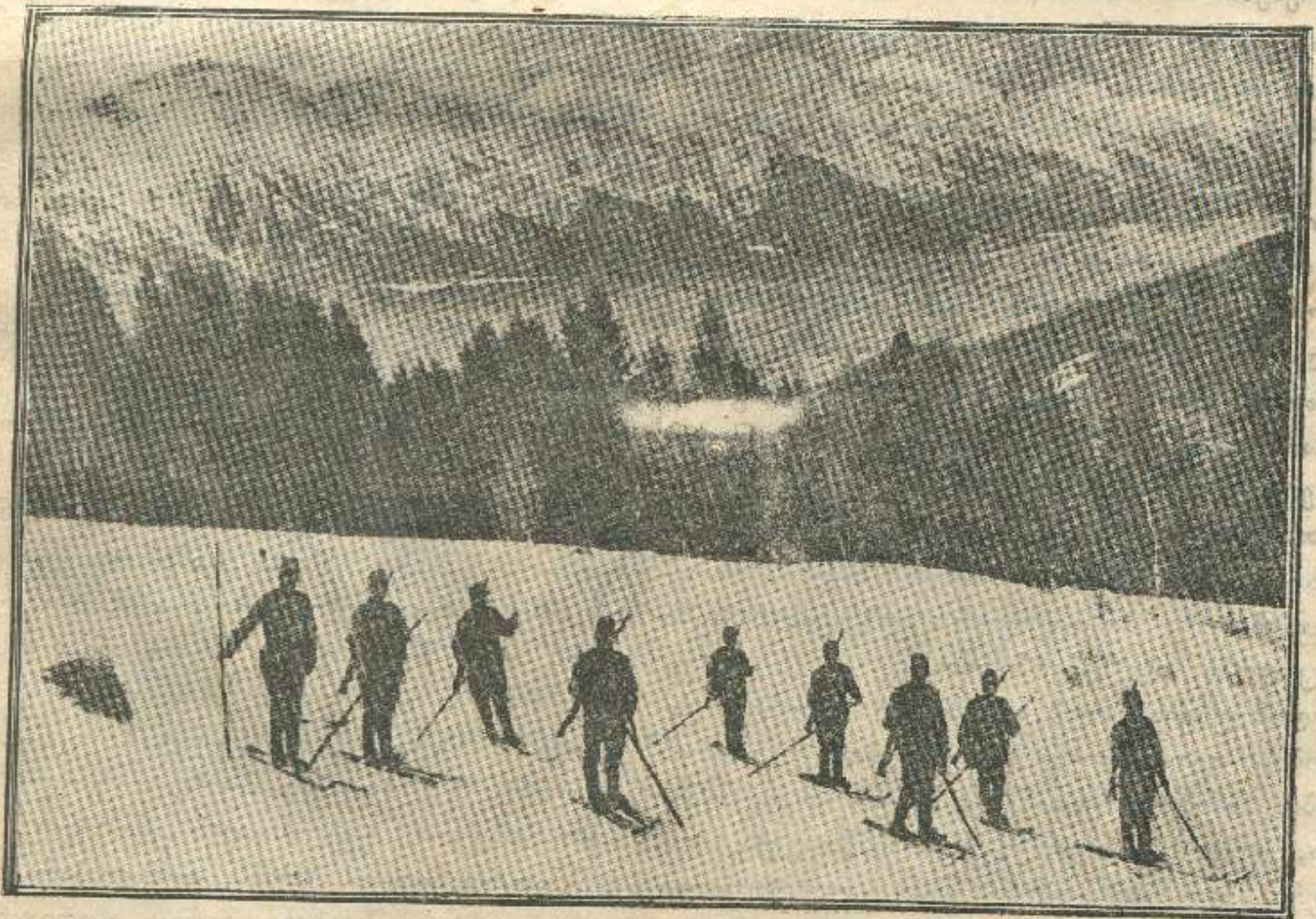
ავსტრიელი ჯარისკაცები თბილამურებით.

მისამართი: თბილისი, გაბაევსკი პერ. № 3 რედაქცია „კლდე“. დეპოზიტის: თბილისი კლდე.