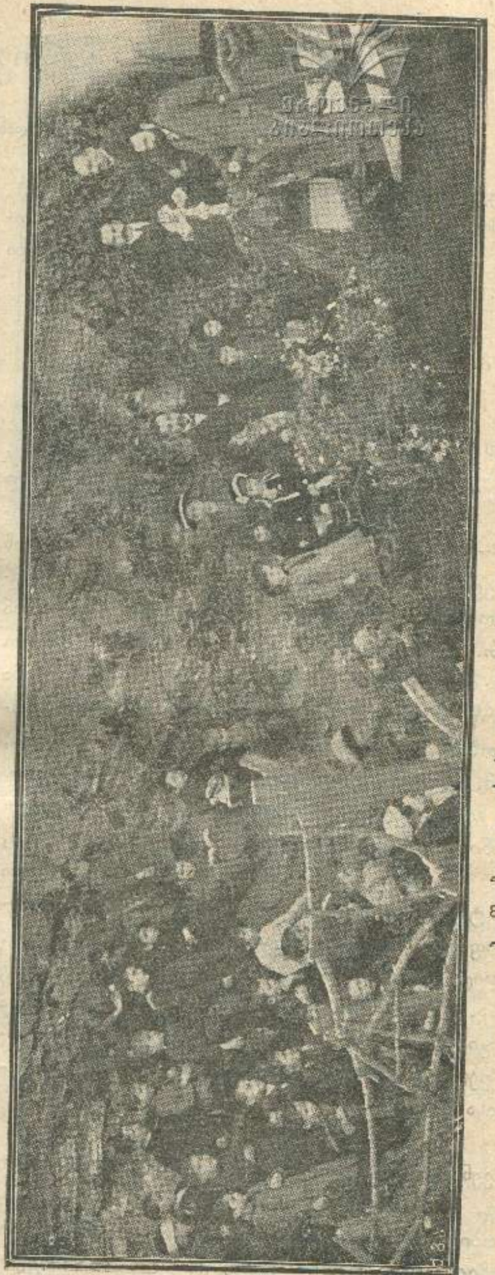
ბავშვები აკაკის საფლავთან.

რა თქმა უნდა, რომ სოფლის ბინადარი მცხოვრებლები არასოდეს არ იფიწყებენ განსვენებულს და ყოველ ჟამსა და წუთს იხსენიებენ მას. და თუ ანდერძით დავალებული ძეგლის მიზანიც მხოლოდ ის იყო, რომ უზრუნველ ეყო განსვენებულს ყოველ წუთს თვისი ხსენება და მემკვიდრეებმაც ასე გაიგეს, არ შეიძლება არ დავეთანხმეთ ამ უკანასკნელთ, რომ მართლაც და განსვენებულმა სიცოცხლეშივე დაიდგა ისეთი ხელთუქმნელი ძეგლი, რომ