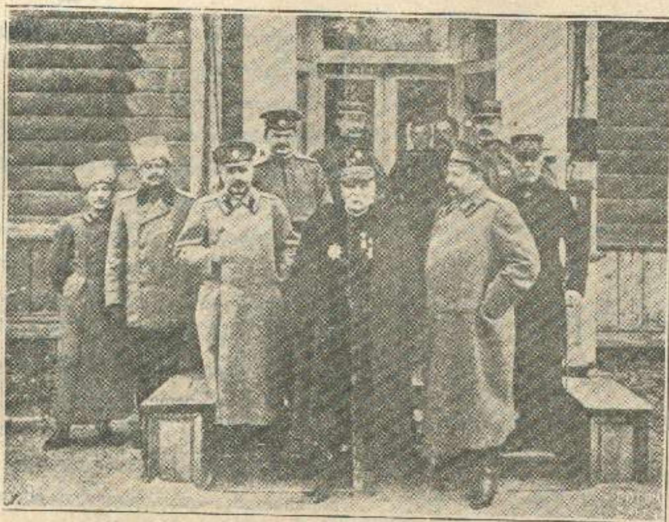
საფრანგეთის ჯარის წარმომადგენლები უმაღლეს მთავარსარდლის შტაბში.