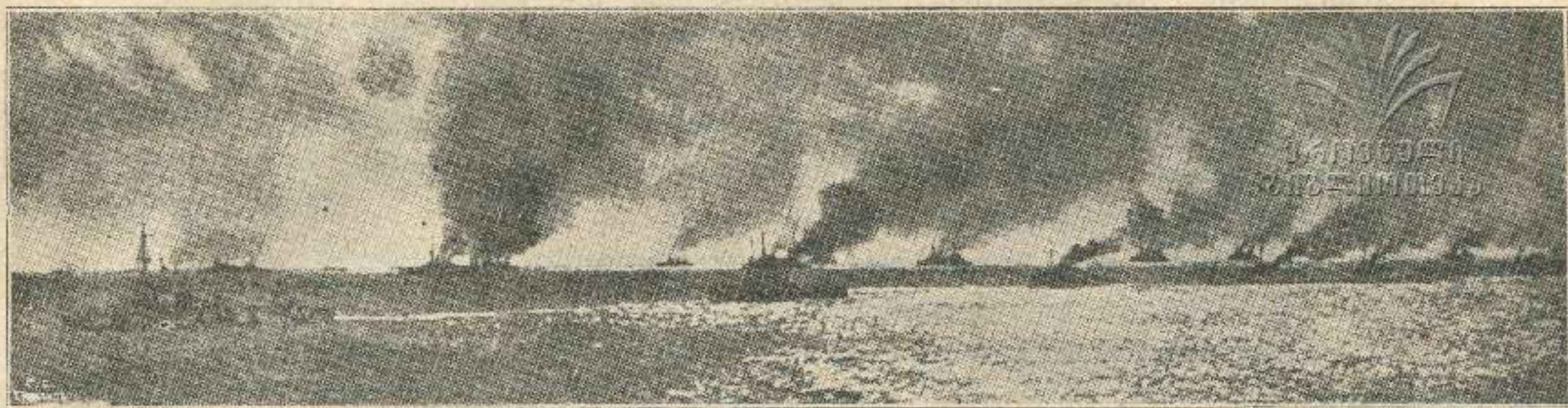
ინგლისელთა ჯაგშნოსნები დარდანელის სრუტესთან.

ბეწნა მუდარით, ხმა და თვით ცხოვრების ინტერესიც კი დაჰკარგვია, მაგრამ მაინც ვერაფერს გამხდარა და ვერ დაუნშინებია საჭირო რიცხვი გზაზე მოსამსახურეთა; ამიტომაც ამ გზაზე, ერთი სადგურიდან რომ გადის მატარებელი, თან მიჰყვება სადგურის უფროსი, ტელეგრაფის მოხელე, „კანტორჩიკი“, მვისრე და სხ. მეორე სადგურზე დასახვედრად და უმალ გასაცილებლად. . ერთი სიტყვით ამ გზაზე ნამდვილი „ნაციონალური კომერცია“ გამეფებულია.