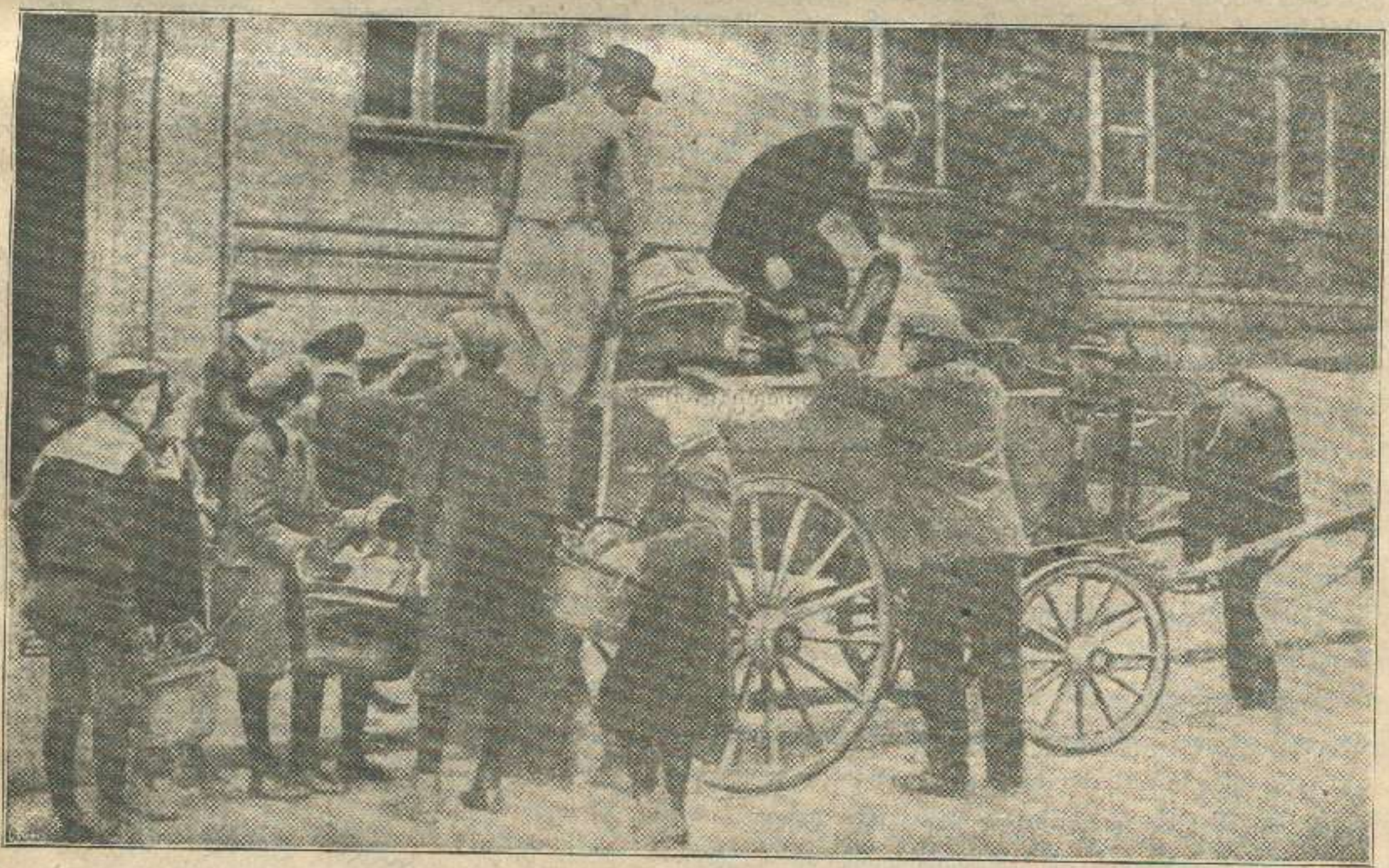
გერმანელები სპილენძეულობას აგროვებენ სამხედრო იარაღსთვის.

სამართლი: თბილისი, გაბაევსკი პერ. № 3 რედაქცია „კლდე“. დეპუტისა: თბილისი კლდე.