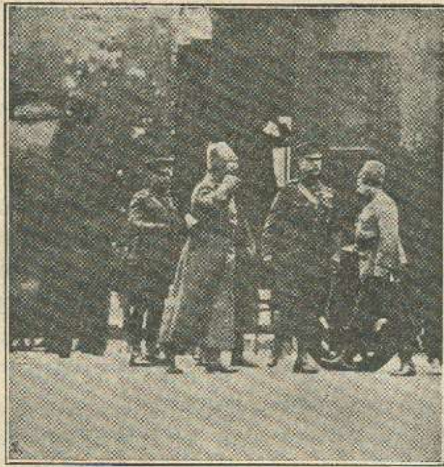
ინგლისის ჯარის წარმომადგენელი უმაღლეს მთავარ-სარდლის შტაბში.