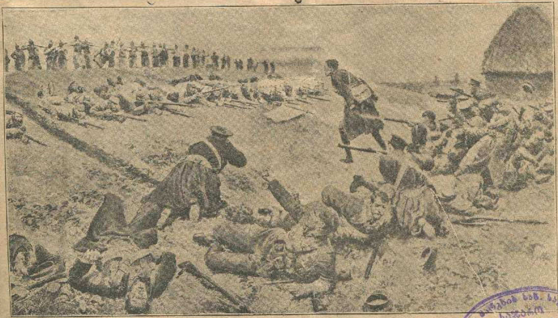
გერმანელები თეთრი დროშით სარგებლობენ და ნადგურებენ მტერს