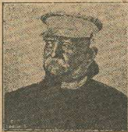
გრაფი ცეპელინი, ხელმძღვანელი გერმანიის საჰაერო ფლოტისა.