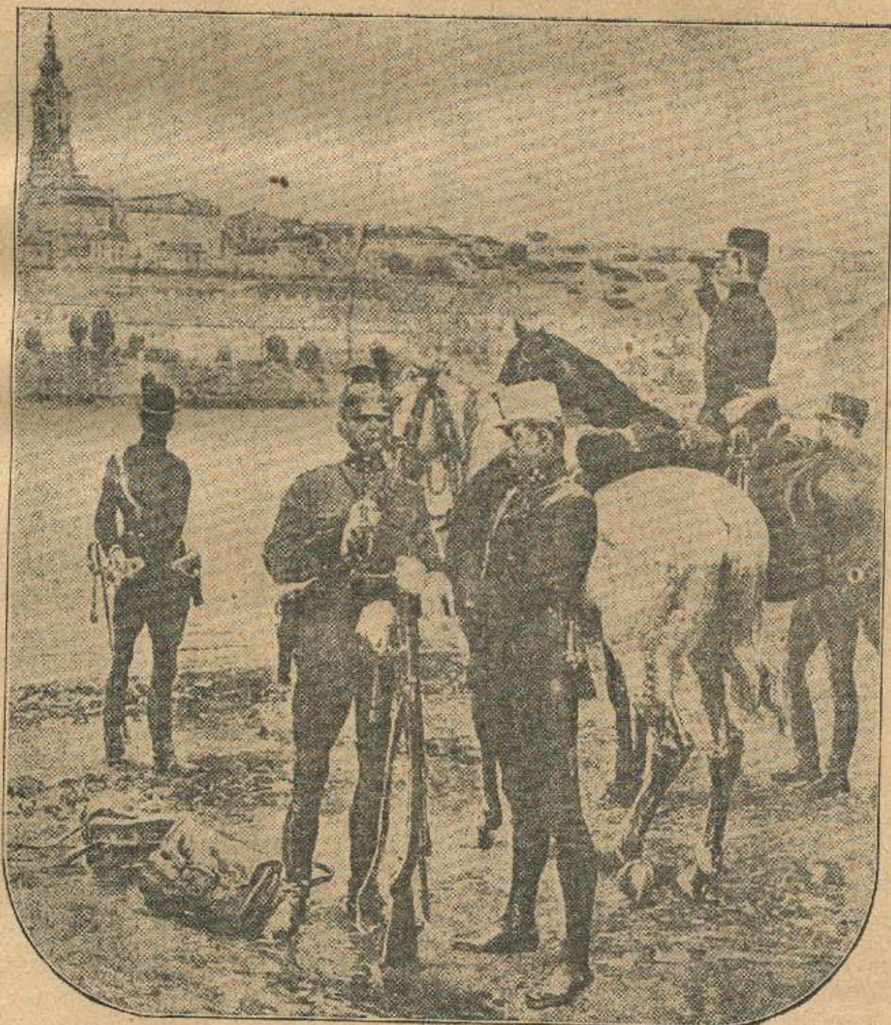
ავსტრიელი აფიცრები გასტქერიან ბელგრადს.

სომხურმა პრესამ შედარებით ნაკლები ყურადღება მიაქცია მეორე სადავო კითხვას, ალექსანდრეტას! უეჭველია, ხმელთა შუა ზღვაში გასვლა მათ მეორე ხარისხოვან საკითხად მოსჩვენებიათ. სომხური პრესა ვერც კი ნიშნავს, რომ, კითხვის ამგვარი დაყენებით პრობლემატიური საკითხი რუსეთის ხმელთა შუა ზღვაში გასასვლელად ასე ადვილად არ გადასწყდება. რა თქმა უნდა, აქ სომეხები ხაზს უსვამენ იმ გარემოებას, თუ რა სასარგებლო იქმნება მათთვის ხმელთა შუა ზღვის დაპყრობა სომხურ