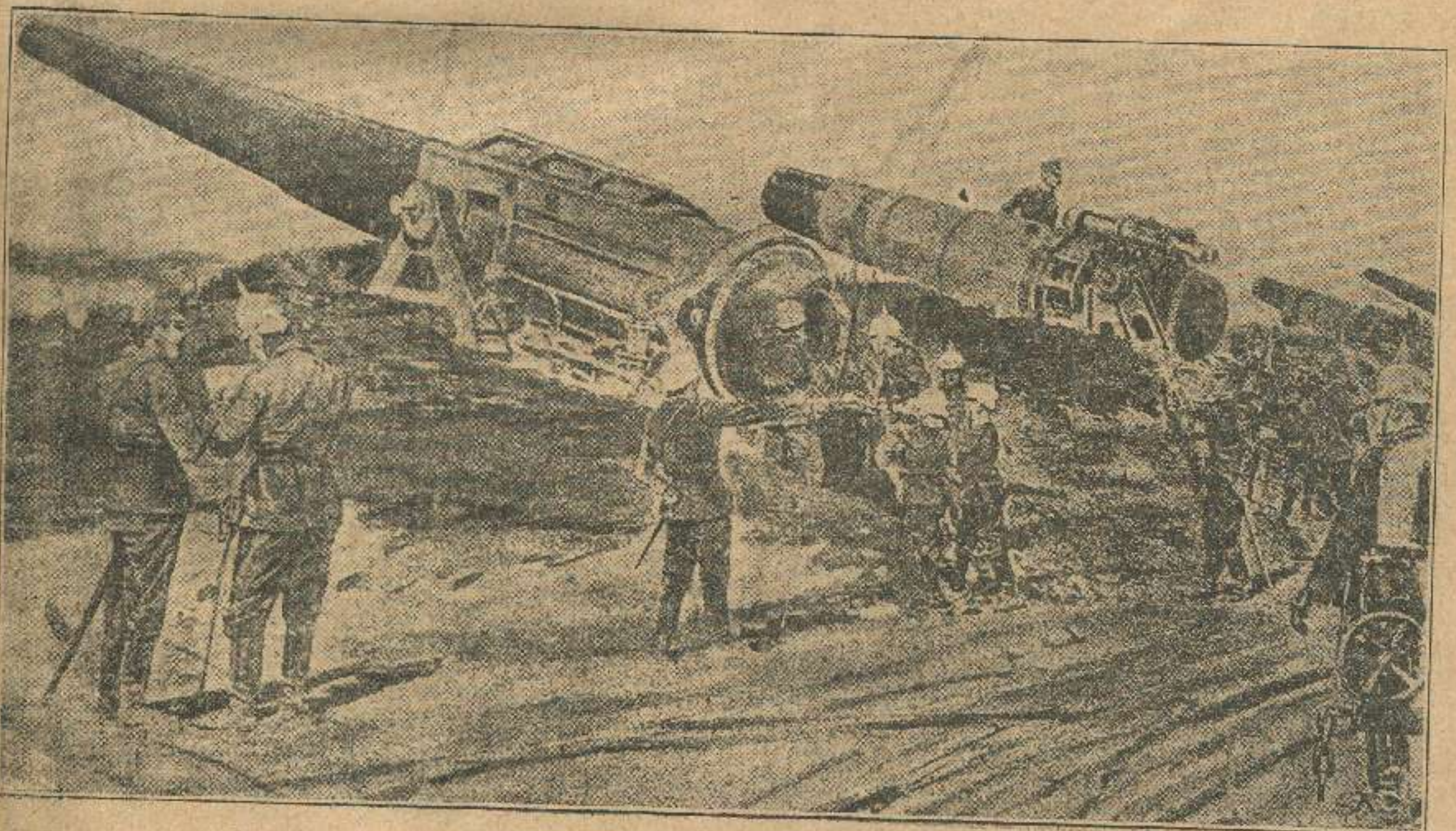
42, სანტიმეტრიან ხარბახნების ბატარეია ანტვერპენთან ბრძოლის დროს.