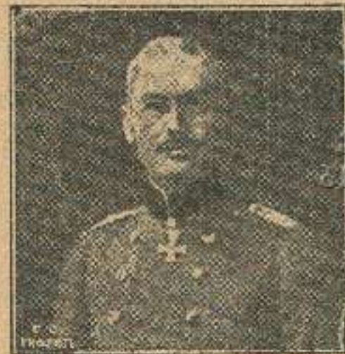
ოსმალეთის შთავარ-სარდალი ლენერალი სანდერი.