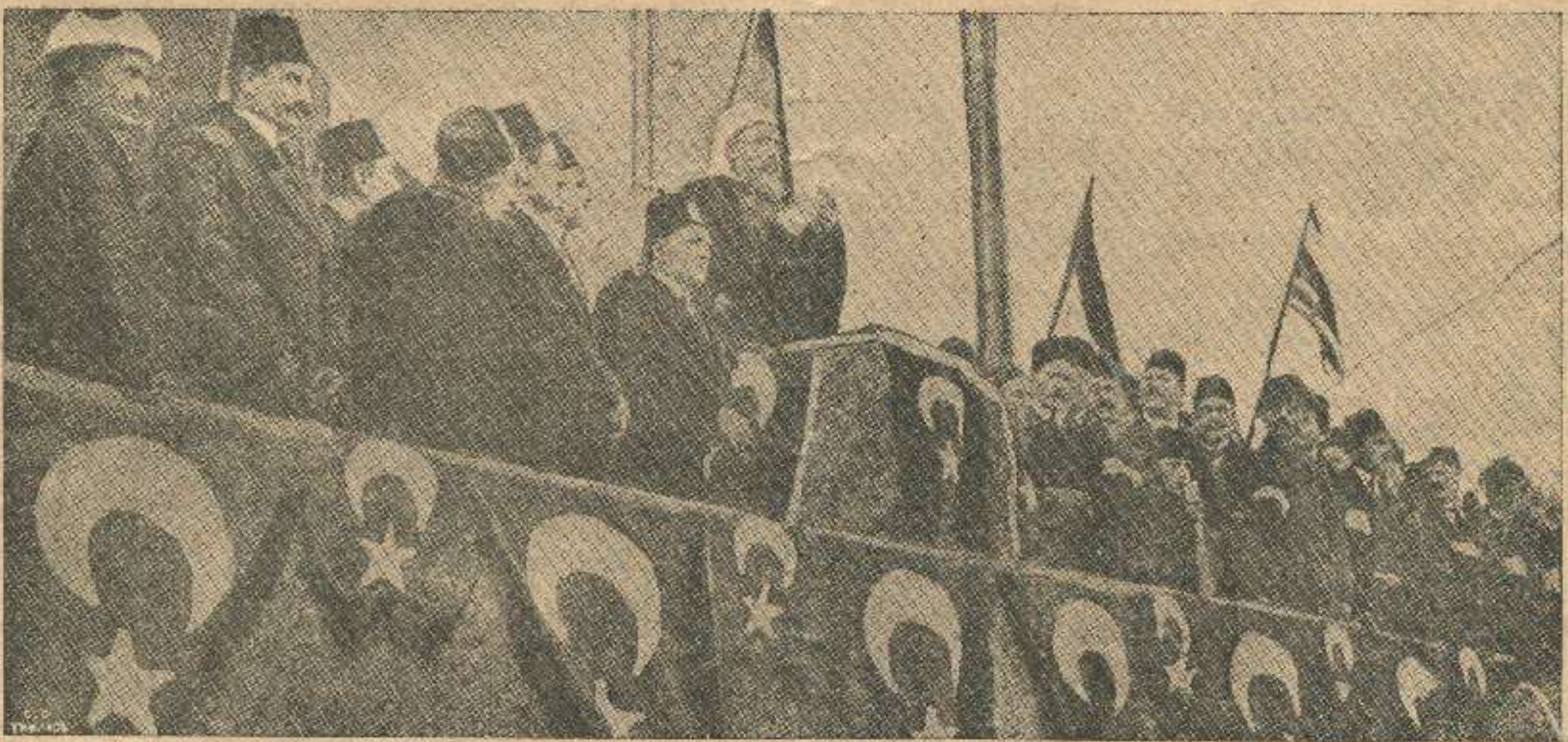
ოსმალეთის სამღვდლოების უფროსი, სტამბოლში შეჩეთის აივნიდგან კითხულობს საღმრთო ომი-სადმი მოწოდებას.

სომხური პრესა, თქმა არ უნდა, უარს ვერ მეტყვის თავისუფალ ვალდებულობაზე. პირიქით „ზაკაკ. სლოვო“-ს სახით ხშირად ქათინაურებს შემასმენდნენ, რომ სომეხთა საკითხი გამერკვია მათ ისე მოეჩვენათ, ვითომც კიდევ გადავჭერი საკითხი და ისიც არა მათ სასარგებლოდ. „პორიზონი“ ამტკიცებს, რომ მე „უვიცთა რიცხვს ვეკუთვნი“. „არვეი“ უფრო თავაზიანია, მისი აზრით, მე საკმაო ცნობები არ მომეპოვებოდა და არც საშუალება მქონდა სომხურ მასალებს დავყრდნობოდი. ასეა თუ ისე, სომხური პრესა იმას კი არა სცდილობს უარპყოს ჩემი დებულებანი, არამედ დამანახვოს მე და ჩემს მკითხველებს, თუ ნამდვილად როგორია სომეხთა შეხედულობა მათ ეროვნულ საკითხების გასარკვევად. უეჭველია, სწორედ ამას უნდა მიეწეროს, როდესაც მათ უმთავრეს საიერიშო ბაზად გაიხადეს ჩემი წერილის შესავლის ერთი