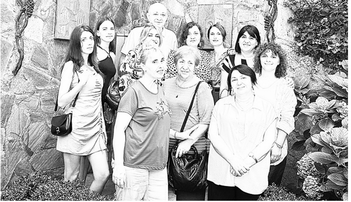
გორც „კავკასიის ქართული კულტურის ასოციაციაში“ სტუმრობისას გავიგეთ, ეძებენ ქართული ენის