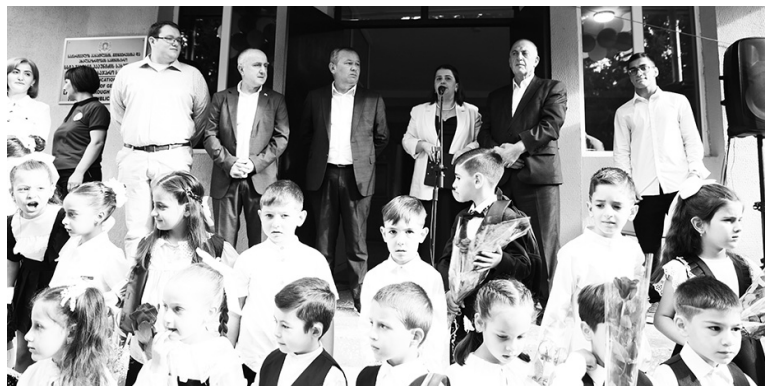
და საზოგადოების წარმომადგენლებს მნიშვნელოვანი დღე მიულოცეს.

მუნიციპალიტეტისა და რესურსცენტრის პირველი პირები იმყოფებოდნენ წინიარისის საჯარო სკოლაში და მოსწავლეებს, პედაგოგებსა