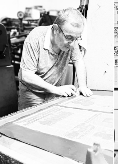
მასწავლებელს, რადგან ბევრმა გამოთქვა წინაპრების ენის შესწავლის სურვილი. დამფუძნებელმა ვოლქან ქარაუროღლუმ გვითხრა, რომ ცდილობენ, არ დაივიწყონ სა-