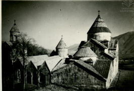
УЦЪЦЪРЪ, ЧЪЦЪРЪ СЪЪЦЪЦЪРЪ СЪУРЪ. IX-XIII в. МОНАСТЫРЬ САНАНН ОБЩИНЪ ВЪД, IX-XIII в.