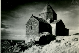
ՍԵՎԱՆ, ԱՐԱՐԵԼԻՑ ՄԵՑ ԵՎԵՂԵՑԻ, IX Դ. ՇԵՐԿՈՎԻ ԽԱ ՇԵՎԱՆԵ IX Ե.