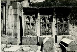
ՇԱՂԱԾԵ. ԿՈՐՈՍՆԵՆ ՍԵՇՂԱԾ ՈՒԶԹՄԸ ԻՄ Դ. РЕЗНОЙ КРЕСТНЫЙ КАМЕНЬ/КАЧМАР/ В АНПАТЕ ИМ В.