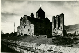
ОЗОНЪ, ЗВЕНИГОРОДСКАЯ ЦРКОВЬ ВЪ ВОЛОГДѢ. ВИДЪ СЪ СЕВЕРОВОСТОКА. VI В.