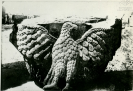
ЕДИНЦОВЪ. ЗЧЦРФУЛБ КЛЗЦА ЦРБЧР РЦЪУЦЧЛЦ VII Г. РАЗВАЛНЫ КРАМА ЗВАРТНОЦ. КАПИТЕЛЬ VII В.