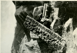
ЦРКЪ. РИШУЧУЦРЪ РЪЧОР ПЪ. КАПИТЕЛИ И КАРНИЗ КРАМА В ГАРНИ П В.