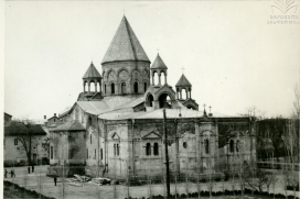
ԷԺՄԻՍՏՆՆ. ՄԱՅՐ ՏՄԵՍՐ ՎԻ Դ. ՅՈՒՆԱԴՅՈՒՆ ԿՐԱՄ ՎԻ Ե.