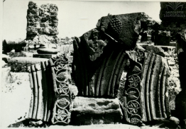
ДЧЦРВЪЛЪ ВЪТЪЦЦДЦРЪ РЪЧПРЪР VII Г. РАЗВАЛНИИ КРАНА ЗВАРНОЦ VII В.