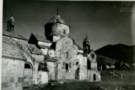
ՀԱՂԻՍԻ ՎԱՆԸ XIII Դ. МОНАСТЫРЬ В АЖПАТЕ XIII В.