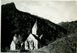
ՍՈՒՐԵՆԻ ՏՈՒՆԵՐԵՆԵՆԵՐԻ ՎԱՆՔԻ ՄԱՆՈՒԿԱՆՈՑ ՄՈՆԱՍՏԻՐԻ ԱԳԱՐՇՆԻ ՄԻՆ.