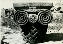
ԶՎԱՐԹՆՈՅ ԿՈԼՈՆՆԻ ՎԻՍՏԻՆԻ ԿԱՍԻՏԵԼԻ ԿՈԼՈՆՆԻ ԿՐԱՄԱ ԶՎԱՐԹՈՑ ՎԻՍՏԻՆԻ