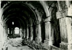
УЖИЦКЪ, УЦЪНУСРЛУИ ДЪУЦРЦЪТЪ ТЪРЪИЪ БЪУДС, XI П. ВНУТРЕННИЙ ВЪД ДУХОВНОЙ СЕМНАРИИ МАГИСТРОС А, XI В.