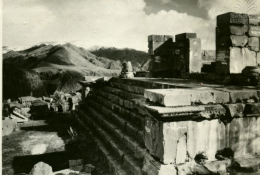
ФУНД. СТЕНЫ ИЗОБРАЖЕНЬ СОВЕТСКОГО И Т. РАЗВАЛИНЫ АНТИЧНОГО КРАНА В ГАРНИ И В.