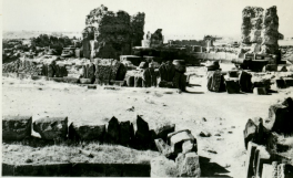
ԵՃԱՆՈՒՅՄ. ԶՎԱՐԹՆՈՆՆ ԿՈՆ Գ. ՅՎԱՐԹՈՑ ԵՆ ՅՇՄՈՒԿԱԶՅՈՒՆԵ ԿՈՆ Ե.