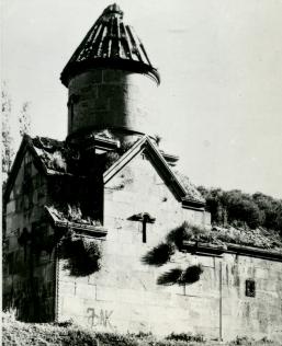
ՕՍԴՂԿԱԶՆՈՒ, ԿԵ ԶՄՈՒԿԱ ՎԱՆՔԵՑ, XII - XIII Դ. ЦАХНАДЗОР, МОНАСТЫРЬ В МЕЦАРНИСЕ, XII - XIII В.