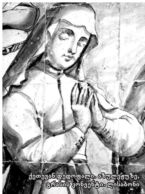
ქეთევან დედოფალი. აზულეჩუზე, გრანსისკონენტი. ლისაბონი

შირაზს, ენკენისთვეს, ჯვართამაღლების წინ, ცად ამალდებოდი ვიდრე, ხალხში მიღეთისა, მცირე ამაღაში, ვიდექ, დედოფალო, ვიდექ. შენ გადამირჩინე მანდილის სინმინდე, რწმენა - ნამებულის მშენი, ჩემი ქართველობა, დედავ ქართველთაო, შენით, დიდმოწამე, შენით. მას აქეთ, ხან ომის ქარცეცხლში ვტრიალებთ, ხანაც, ვაყურადებთ ებნებს, წმინდა ნატერფალი, სამუხრანოს გზებზე, ვებნებ, სანატრელო, ვებნებ. კატრინ-გვატემალად, ინდოეთს, ესპანეთს და რომაელებში გპოვე. ახლა უფრო მეტად გიხმობ, ვარდფეროვანს, მოვედ, ტყვედპყრობილო, მოვედ! შენი საქართველო ისევ მწუხარება და ახალ იარებს ითვლის, ისევ ავიშლანეთ, ისევ „მამ მას ბისტი“,