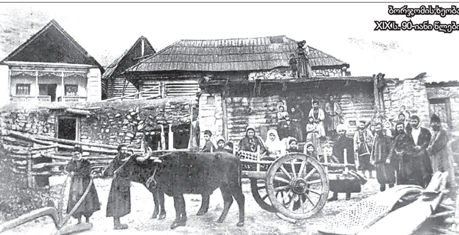
ბორჯომის ხეობა XIX ს. 90-იანი წლები