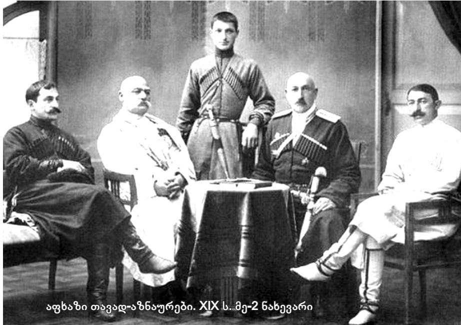
აფხაზი თავადაზნაურები. XIX ს. მე-2 ნახევარი

დ. სვიატოპოლ-მირსკის გეგმა მთავარსარდალმა მოიწონა, ხოლო აფხაზეთის ყოფილი მთავრის უძრავი ქონების შესაფასებლად საგანგებო კომისია შეიქმნა სამი კაცის შემადგენლობით. მის თავმჯდომარედ მეფისნაცვლის საბჭოს წევრი, გენერალ-მაიორი ი. ბართოლომიე დაინიშნა.