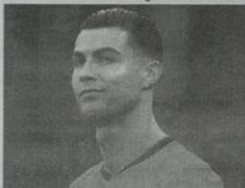
კრიტიკონი რონალდო ნაკაზიკიანე სპორტანორი გუნდების მწვრთნელობის არ პირებს

რომ პორტუგალიის ნაკრებში ასპარეზობის დასრულება ვერ არ გადაწყვეტია.