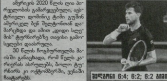
შედეგი 6:4; 6:2; 6:2 ბიეა