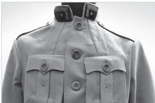
Генеральский китель генерала Г.И. Квинитадзе (передан в дар Грузии членами семьи генерала)

Имя генерала Квинитадзе вошло в историю русской армии, как пример доблестного военачальника, а в историю Грузии как истинного патриота, сохранившего дух и исторические традиции своей Родины.