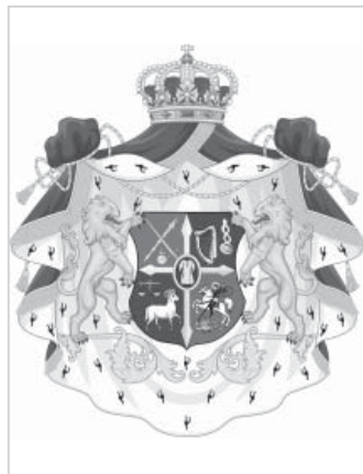
Плита на могиле генерал-лейтенанта А.И. Багратиона-Мухранского и фамильный герб