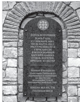
Общий вид церкви Св. Иоанна Златоуста в Багреевке (слева) в память о массовых расстрелах, увековеченных на памятной плите (справа), укрепленной на ее наружной стене

Награжден орденами: «Св. Анны» III ст. (1906) и II ст. (1914); «Св. Станислава» II ст. (1912), «Св. Владимира» IV ст. (1915).