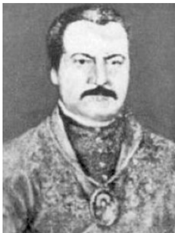
ბაქარ ვახტანგის ძე ბაგრატიონი

ქართველები აქტიურად იბრძოდნენ რუსეთ-შვედეთის 1741-1743 წლების ომშიც. პეტრე I-ის მიერ დაწყებული სამხედრო-საზღვაო ხელოვნების განვითარებაში დიდი წვლილი შეიტანა გენერალ-მაიორმა გიორგი ვახტანგის ძე ბაგრატიონმა (1712-1786). მან დაწვრილებით დაამუშავა მოწინააღმდეგის ტერიტორიაზე სამხედრო ძალების დესანტირების ტაქტიკური და სტრატეგიული საკითხები, რითაც იბრძებოდა მოწინააღმდეგის ცოცხალი ძალებისა და თავდაცვითი ნაგებობების განადგურების შესაძლებლობა.