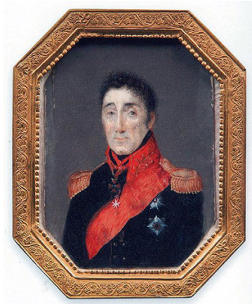
გენერალ-ლეიტენანტი სიმონ ივანეს ძე სალაგოვი (სოლოლაშვილი)