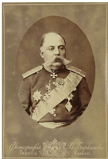
იაკობ ალხაზიშვილი (ალხაზოვი)

ჯარის წინააღმდეგობა, ის ყარსს მიაღვა. ოსმალეთის ჯარების მეთაურს - მუხტარ ფაშას მისი გადაადგილებების შესახებ ცნობები არ გააჩნდა და უკან დახევა გადაწყვიტა. ყარსის 8 ათასიანი გარნიზონის მეთაურად მან აენი-ფაშა დატოვა და 5 ათასი მებრძოლით სოღანლულის უღელტეხილის გასამაგრებლად დაიძრა. მას უკან სდევდა ჭავჭავაძის კავალერია. კორპუსის დანარჩენმა ძალებმა ყარსის ბლოკადა დაიწყეს. ყარსის მისადგომებთან დიდი მხედართმთავრული ნიჭი გა-