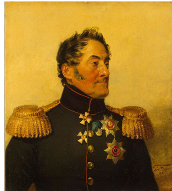
არტილერიის გენერალი ლევან მიხეილის ძე იაშვილი