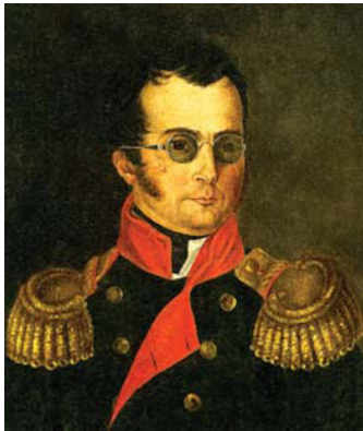
გენერალ-მაიორი პავლე სერგის ძე ლაშქაროვი (ლაშქარაშვილი)