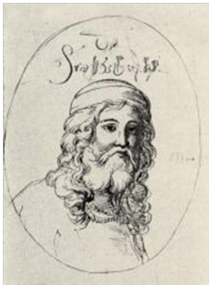
აბაზა მეჭმედ ფაშა

ნ.ჯაველიძის მართებული შენიშვნით, „აქ იბერიის ქვეშ უნდა იგულისხმებოდეს ზოგადად საქართველო“. ასევე ქართველად არის იგი მოხსენიებული მეჭმედ სურეიას მიერ XIX საუკუნეში შედგენილ ოსმალეთის გამოჩენილ პირთა ბიოგრაფიულ ლექსიკონში.