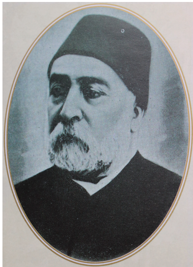
მეჰმედ ნეჯიმ ფაშა

ქართული წარმომავლობის ოჯახში დაბადებული მაჰმედ შევკატ-ფაშა, რომელსაც იმპერიის უმაღლეს თანამდებობაზე დანიშვნის დროისათვის, უკვე მარშლის უმაღლესი სამხედრო წოდება ჰქონდა მიღებული. ისიც აღსანიშნავია, რომ შეთავსებით მან სამხედრო მინისტრის პოსტიც ჩაიბარა.