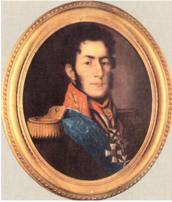
ინფანტერიის გენერალი პეტრე ივანეს ძე ბაგრატიონი