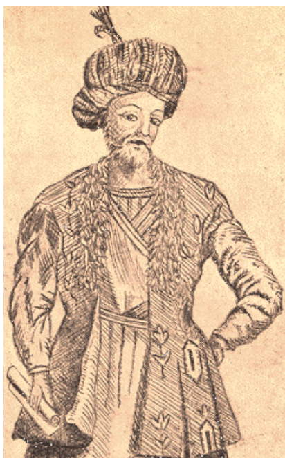
როსტომ ხან სააკაძე

ასევე დიდი გავლენითა და ავტორიტეტით სარგებლობდა სეფიანთა სამეფო კარზე მოღვაწე ქართველი მხედართმთავარი, 1632-1633 წლებში სარდალი, ხოლო 1634-1635 წლებში სპარსეთის ჯარის სპასალარი და აზერბაიჯანის ბეგლარბეგი როსტომ-ხან სააკაძე, გიორგი სააკაძის ბიძა, რომელსაც სპარსული