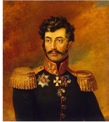
გენერალ-მაიორი რომან ბაგრატიონი