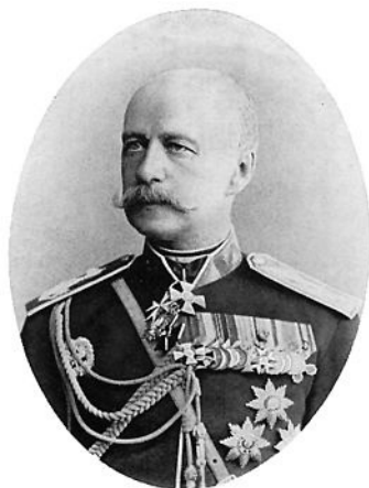
ალექსანდრე ბაგრატიონი (იმერეტინსკი)

გენერალ-ლეიტენანტი ალექსანდრე კონსტანტინეს ძე ბაგრატიონი 1877 წლის ივნისში დაინიშნა პლევენის შტურმის მეთვალყურედ, ის თავად იმპერატორმა პლევენის აღყის დროს გამოჩენილი გმირობისათვის დააჯილდოვა ოქროს ხმლით. 1877 წლის 3 აგვისტოს ის დაინიშნა მეორე ქვეითი დივიზიის მეთაურად, ამავე წლის