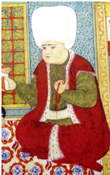
გურჯი მეჰმედ ფაშა - 1

მართლაც რომ, საკმაოდ შთამბეჭდავია წარმოშობით ქართველ დიდგვირთა ნუსხა და მათი საქმიანობისა და გაქანების ასპარეზის მასშტაბურობა. პირველი ქართველი, ვინც ბავშვობისას სამშობლოდან გატაცებული, ოსმალეთში მონად გაუყიდიათ და სწორედ პიროვნული თვისებებისა და სულიერი ძალების წყალობით სახელმწიფო თანამდებობებზე მალევე დანიშნაურებულა, გურჯი მეჰმედ-ფაშა (1536-1626) იყო. ახალგაზრდობის წლებში იგი სულთნის სასახლეში სხვა-