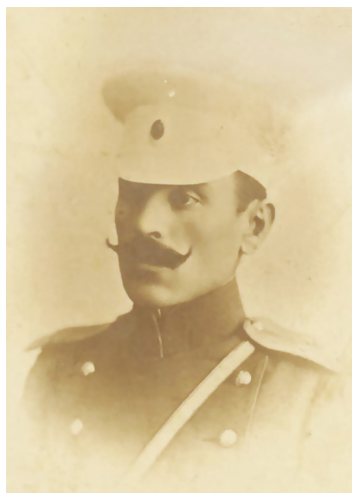
გიორგი მაზნიაშვილი (მაზნიევი)

-მაც მოინახულა. უკვე რუსეთის დროებითი მთავრობის პერიოდში 1917 წლის 5 აგვისტოს ის დაჯილდოვდა „წმინდა გიორგის IV ხარისხის ორდენით.