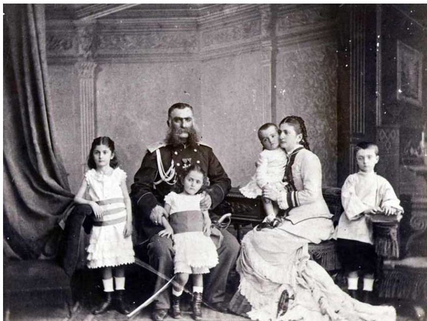
გენერალი - ივანე ამილახვარი ოჯახით

კი მონაწილეობდა. ქართველი არისტოკრატი ქალები მონაწილეობის დებად მიდიოდნენ და ილუპებოდნენ კიდევ ფრონტზე. ერთ-ერთი ასეთი მონაწილეთის და იყო რუსეთის არმიის ცნობილი გენერლის ნიკო ჭავჭავაძის მეუღლე – ანასტასია ერისთავი-ჭავჭავაძე. ის არტანში დაიღუპა.